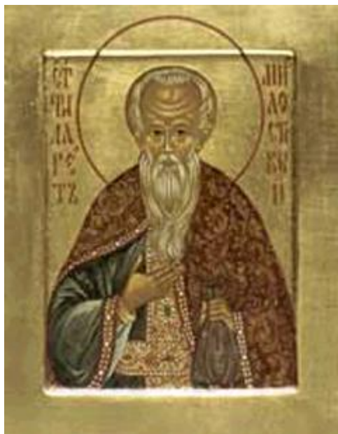
Άγιος Φιλάρετος ο Ελεήμων