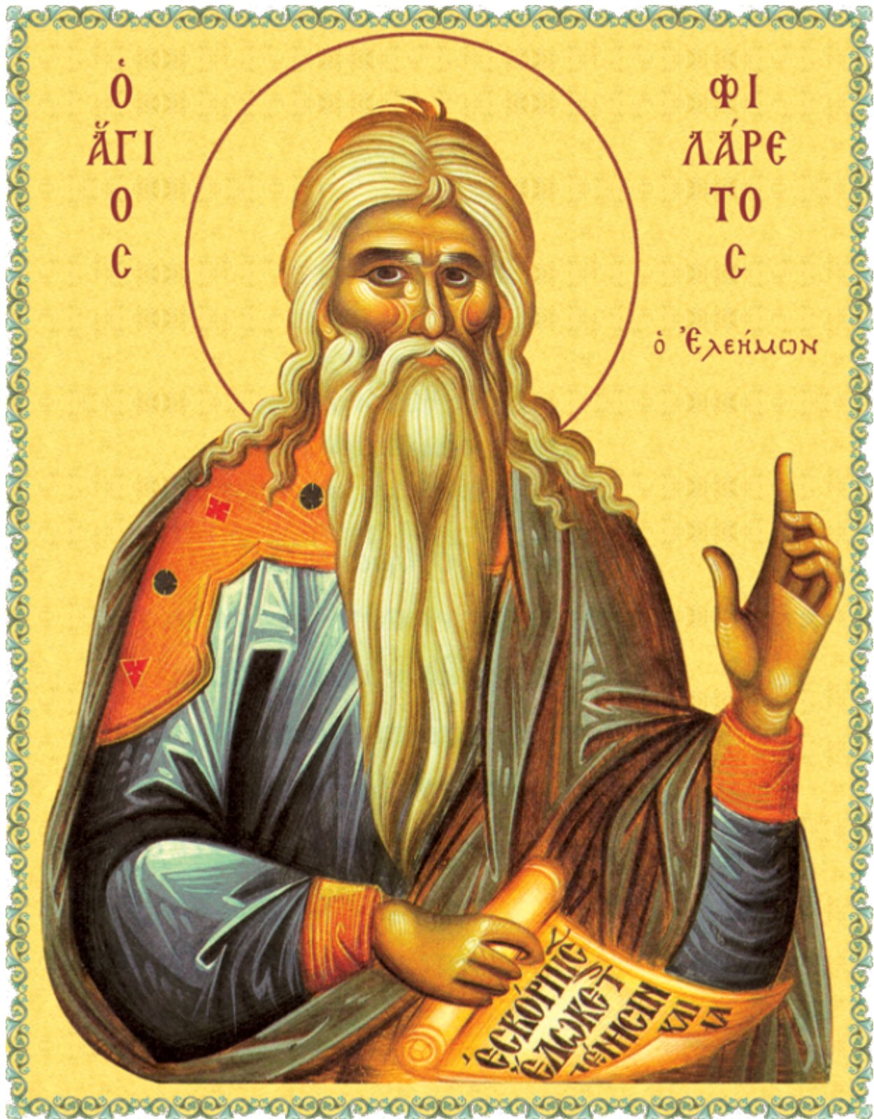
Ἅγιος Φιλάρετος ὁ Ἐλεήμων

Εορτάζει στις 1 Δεκεμβρίου εκάστου έτους.