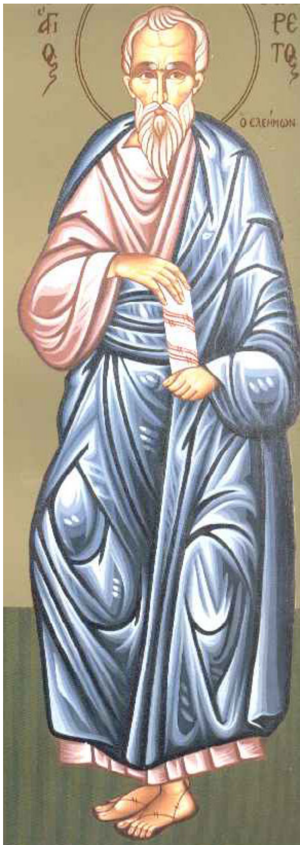
Άγιος Φιλάρετος ο Ελεήμων