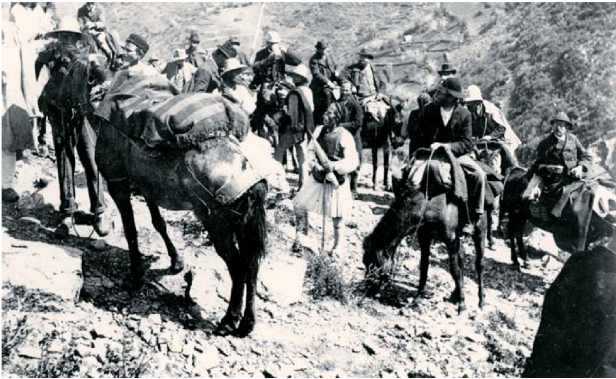
Φοιτητές της ΑΣΚΣΑ ταξιδεύοντας προς τις Βάσσες, 1896.

Κατά το χειμερινό εξάμηνο, υπό την επίβλεψη του διδακτικού προσωπικού της Σχολής, οι φοιτητές-μέλη του ετήσιου προγράμματος συμμετέχουν σε πέντε εκπαιδευτικά ταξίδια που καλύπτουν το μεγαλύτερο μέρος της Ελλάδας, από τη Σαμοθράκη στα βόρεια ως τον Κομμό στη νότια ακτή της Κρήτης. Κατά τη διάρκεια του έτους, οι φοιτητές παρακολουθούν τα σεμινάρια δύο επισκεπτών καθηγητών από επιστημονικά ιδρύματα της Βόρειας Αμερικής και έχουν τη δυνατότητα να επισκεφτούν μουσεία, ανασκαφές και μνημεία στην Αθήνα και την Αττική. Τέλος, οι φοιτητές της Σχολής μπορούν να συμμετάσχουν στην ανασκαφή της Κορίνθου, σε εκπαιδευτικά ταξίδια στη Μικρά Ασία και αλλού, ή να αφοσιωθούν στην επιστημονική τους έρευνα.