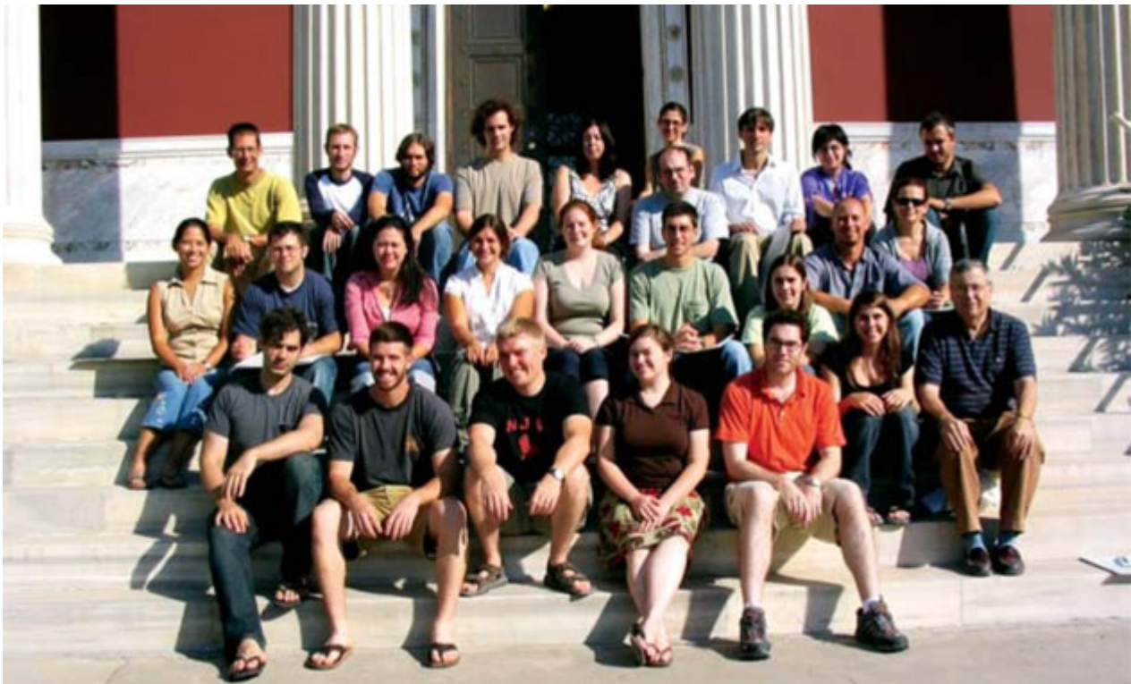
Φοιτητές της ΑΣΚΣΑ