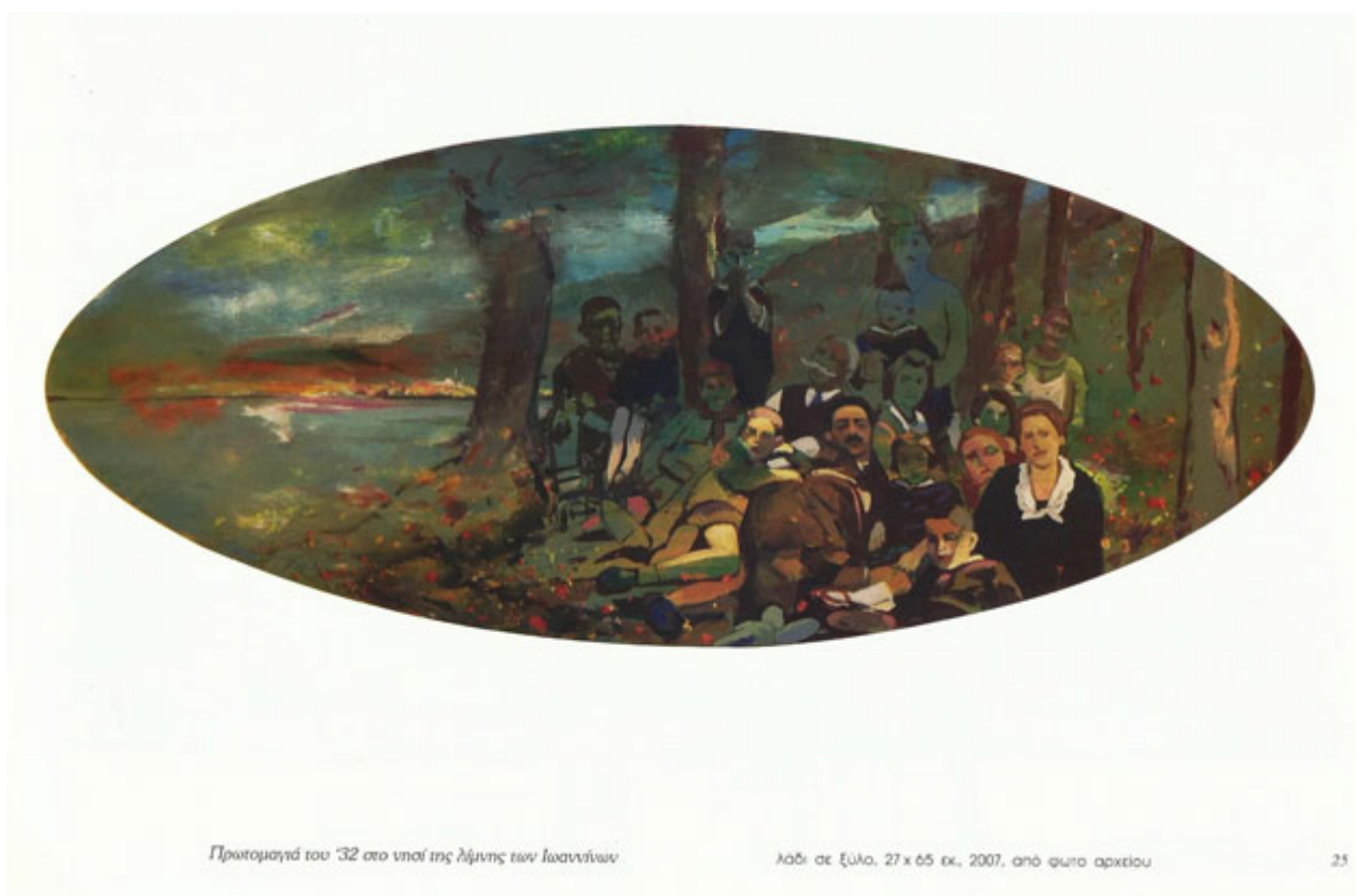
Πρωτομαγιά του '32 στο νοσί της λίμνης των Ιωαννίνων