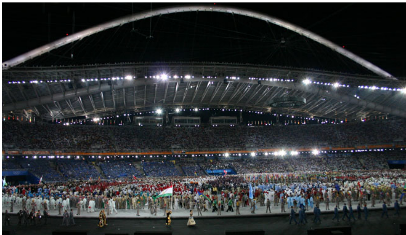
Στιγμιότυπο από την τελετή έναρξης των Ολυμπιακών Αγώνων της Αθήνας, στις 13 Αυγούστου του 2004.