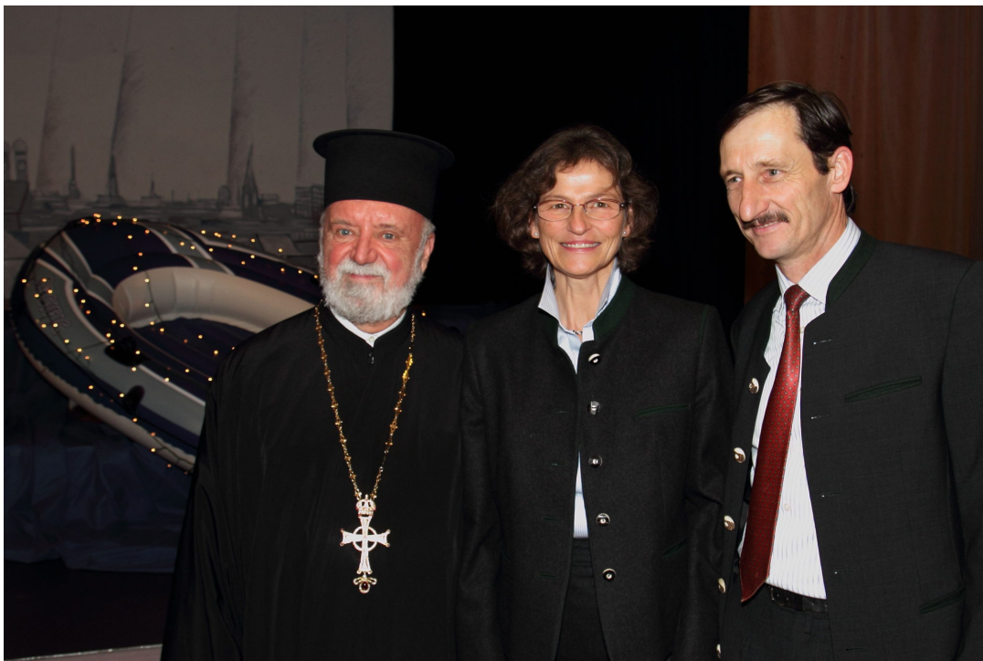
Σύμβολο Ελληνο-Βαυαρικής φιλίας: ο Πρίγκηπας της Βαυαρίας Γουστάβος με τη σύζυγό του και τον Πρωτοπρεσβύτερο Απόστολο Μαλαμούση. Ο Πρίγκηπας κατάγεται από τον Βασιλικό Οίκο από τον οποίο καταγόταν και ο Βασιλέας Όθωνας της Ελλάδος

Εφέτος τοποθετήσαμε στο Πολιτιστικό Κέντρο „Οικουμενικός Πατριάρχης Βαρθολομαίος“ μία συμβολική λέμβο που έχει εξωκοίλει σε κάποιο από τα νησιά του Αιγαίου (Λέσβος, Χίος, Κως, Ρόδος κ.λ.π.), μεταφέροντας ανθρώπινες ζωές κατατρεγμένων και εν περιστάσει όντων προσφύγων. Ως σκηνικό φόντο χρησιμοποιήσαμε τη σιλουέτα της πόλης Μονάχου για να καταδείξουμε τον ποθούμενο πρώτο σταθμό μιας περιπετειώδους ευρωπαϊκής οδύσσειας των προσφύγων από το Αιγαίο, μέσω βαλκανίων χωρών στη κεντρική Ευρώπη. Με την παράσταση αυτή θέλουμε να τονίσουμε την ελληνο-βαυαρική διεκκλησιαστική ανθρώπινη γέφυρα υποδοχής προσφύγων και την πρώτη παροχή βοήθειας. Με τη „Χριστουγεννιάτικη Λέμβο“ εκφράζουμε την αμέριστη συμπαράσταση και αλληλεγγύη της Ορθόδοξης Επισκοπικής Συνέλευσης στη Γερμανία και ιδιαίτερα του προέδρου της, Σεβασμιωτάτου Μητροπολίτη Γερμανίας κ. Αυγουστίνου προς τους πρόσφυγες, που έρχονται από το Αιγαίο Πέλαγος και τη Μεσόγειο Θάλασσα και τη προσευχή μας για τη σωτηρία τους“.