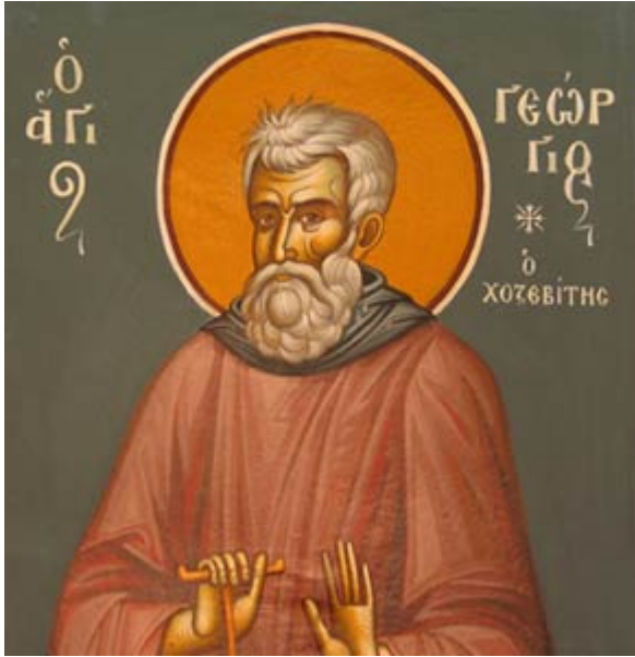
Όσιος Γεώργιος ο Χοζεβίτης

Εορτάζει στις 8 Ιανουαρίου εκάστου έτους.