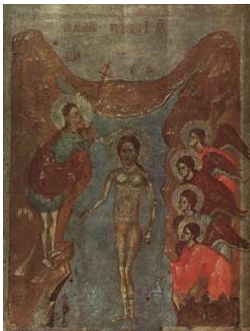
Αγία Θεοφάνεια - Ρώσικη εικόνα (Pskov), τέλος 13ου, αρχές 14ου αιώνα μ.Χ.