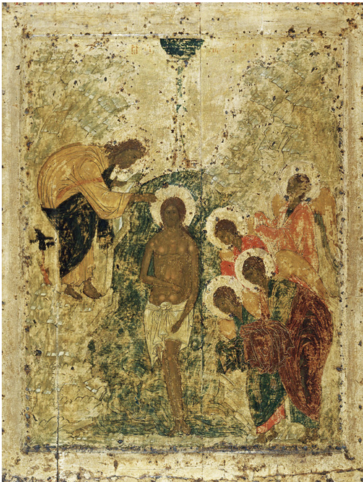
Αντρέι Ρουμπλιόβ - Η Βάπτιση, Ναός του Ευαγγελισμού, 1405