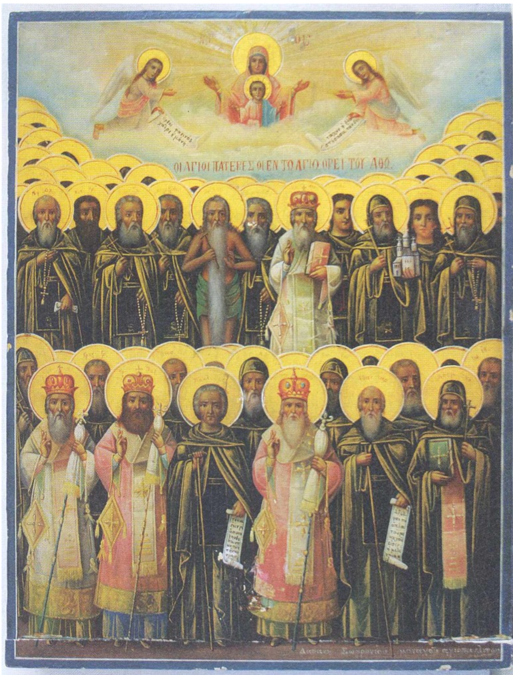
Οι Άγιοι Πατέρες οι εν τω Αγίω Όρει του Αθω. Φορητή εικόνα Ι.Μ. Αγίου Παύλου (αρχές 20ου αιώνα). Από το βιβλίο «Οι Άγιοι του Αγίου Όρους», Μωυσέως Μοναχού Αγιορείτου, εκδ. Μυγδονία (σελ. 304).

Εστάλη κάποτε από τους πατέρες της Μονής στη Βουλγαρία, στο Σφιστόβι, όπου η Μονή είχε μετόχι, για να συγκεντρώσει κάποια έσοδα για τη Μονή.