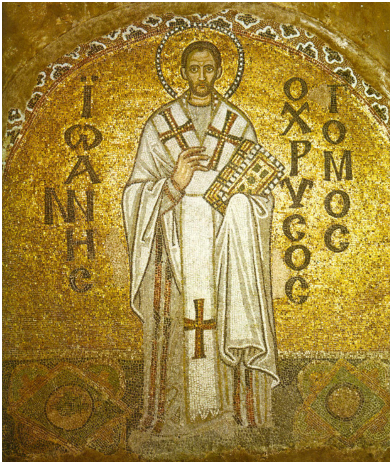
Άγιος Ιωάννης ο Χρυσόστομος