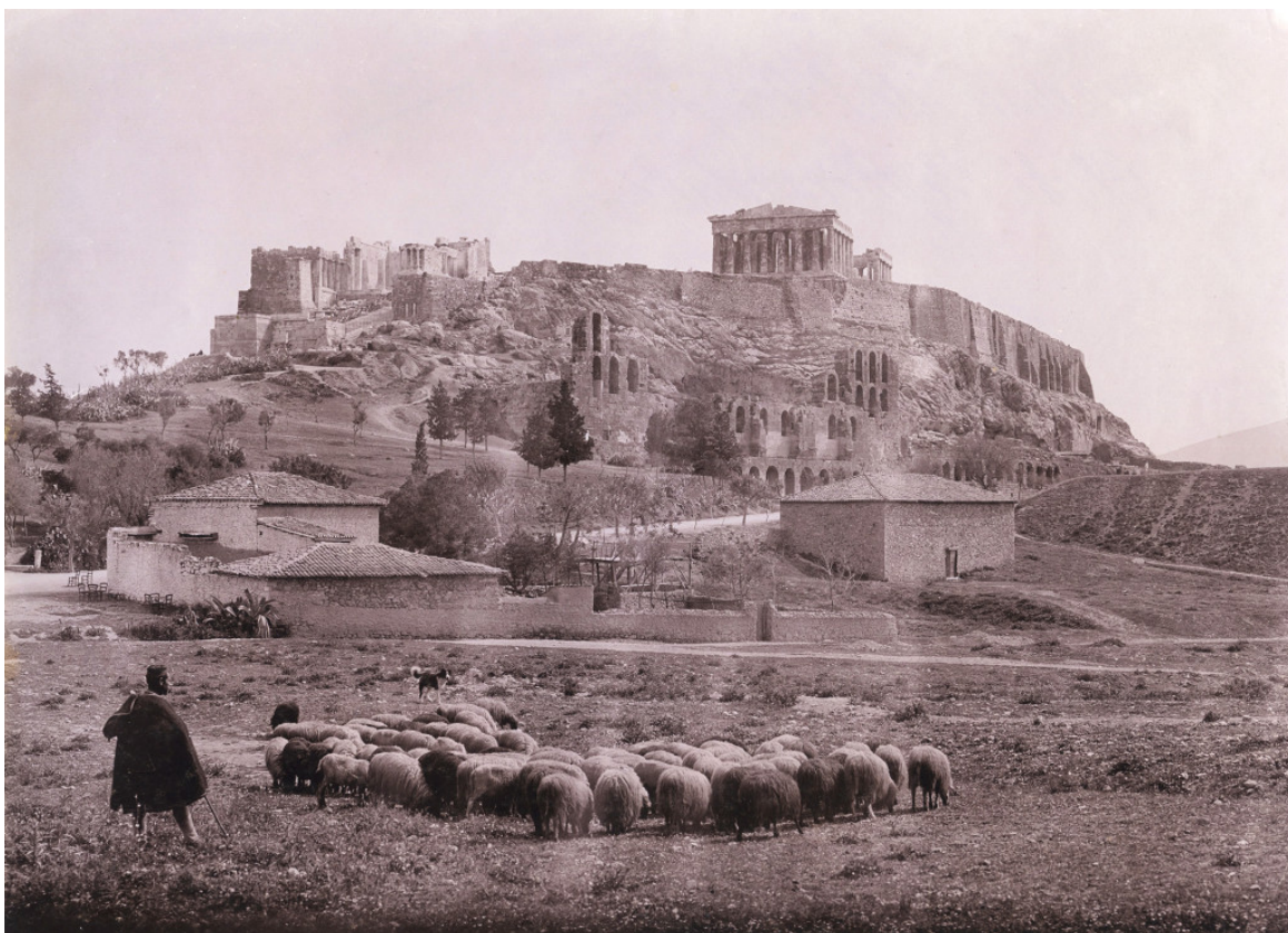
Βοσκός με το κοπάδι του με φόντο την Ακρόπολη, 1903

Το Εθνικό Αρχαιολογικό Μουσείο γιορτάζει φέτος τα 150 χρόνια από τη θεμελίωσή του, (θεμελιώθηκε το 1866 σε οικόπεδο που δώρισε η Ελένη Τοσίτσα). Με αφορμή αυτήν την επέτειο, εγκαινιάζει μια σειρά από δράσεις, με στόχο να φωτιστεί η ιστορία και η προσφορά του στα πολιτιστικά και όχι μόνον πράγματα της χώρας. Αξίζει εδώ να σημειωθεί ότι η κατασκευή του μουσείου βασίστηκε σε σχέδια των Lange, Κάλκου και Ziller.