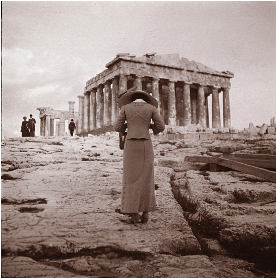
Φωτογραφία ανώνυμου: Η φωτογράφος της Ακρόπολης, 15 Απριλίου 1911 (Συλλογή Χάρη Γιακουμή / Kallimages, Παρισι)

Η πρώτη από αυτές φιλοξενείται στο Καφέ του Μουσείου, έναν ιδιαίτερο χώρο όχι μόνο αναψυχής αλλά «στέκι» καλλιτεχνών και εικαστικών ομάδων, όπου τους δίνεται η δυνατότητα να εκφράζονται καλλιτεχνικά.