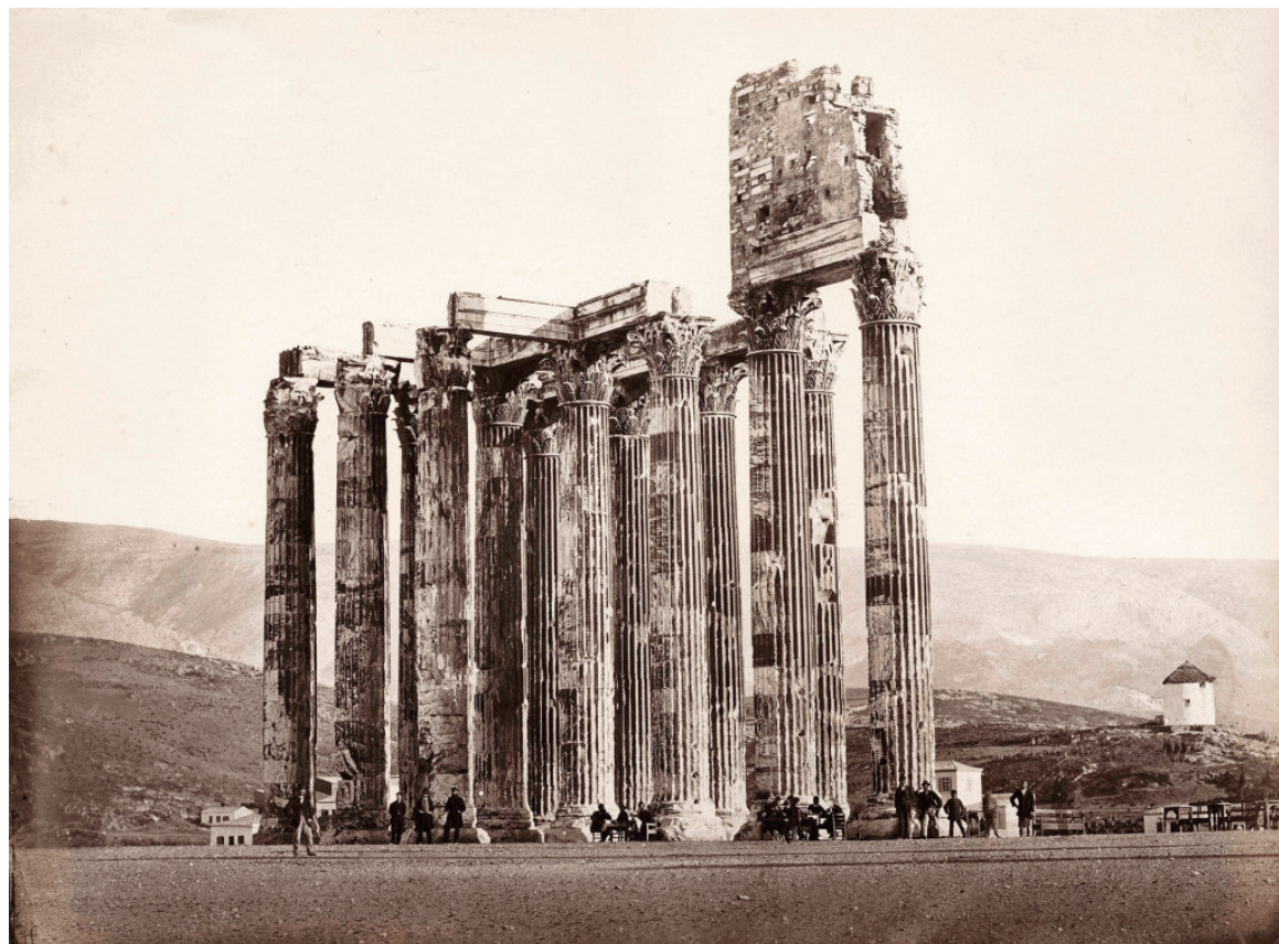
Δημήτριος Κωνσταντίνου: Θαμώνες του καφενείου στο ναό Ολυμπίου Διός. Διακρίνεται η σκίτη του στυλίτη μοναχού και στα δεξιά ο μύλος του Μετς σε πλήρη λειτουργία, 1865

Με αφετηρία την πρώτη φωτογραφική λήψη που έγινε στην Ελλάδα το 1839, ξεδιπλώνεται ένα πανόραμα φωτογραφικών και τρισδιάστατων παρουσιάσεων, με εκτυπώσεις και στερεοσκόπια του 1900. Τα έργα που επιλέγηκαν, προβάλλουν όψεις του πρώιμου αστικού τοπίου, της καθημερινότητας των κατοίκων της πόλης και τις στιγμές, που η ταχύτητα του φωτογραφικής λήψης ήταν βραδύτερη από την κίνηση της ζωής, μετατρέποντας τις ζωντανές φιγούρες σε σκιές του χρόνου.