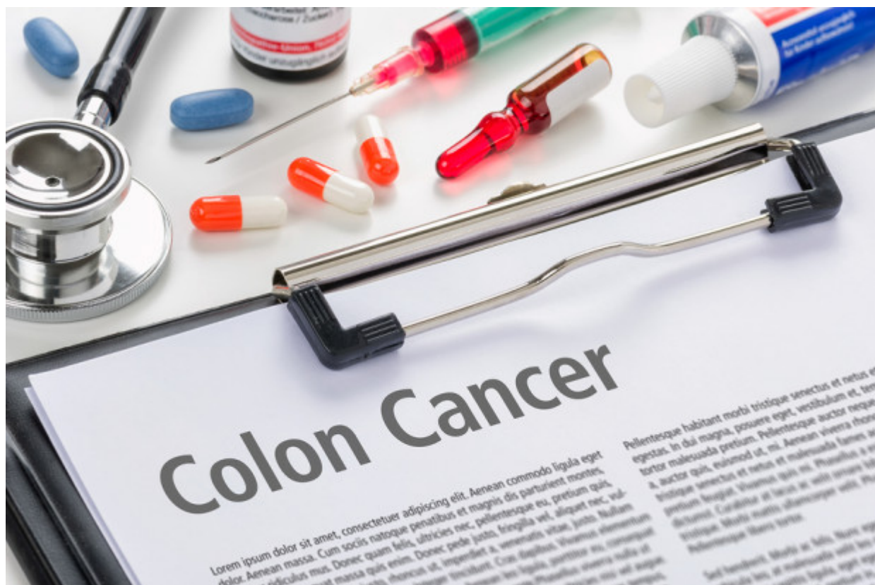
The diagnosis Colon Cancer written on a clipboard

Το ευχάριστο είναι ότι ο καρκίνος του παχέος εντέρου φαίνεται να έχει καλύτερη πρόγνωση στους νεότερους.