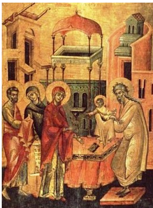
Δίκαιος Συμεών ο Θεοδόχος και Άννα η Προφήτιδα