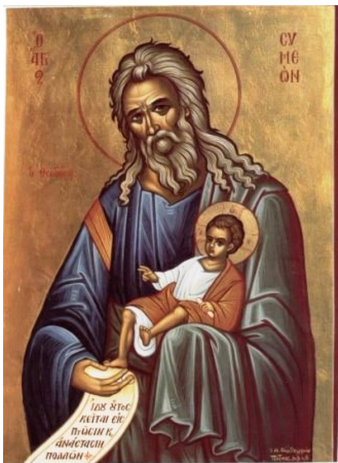
Δίκαιος Συμεών ο Θεοδόχος