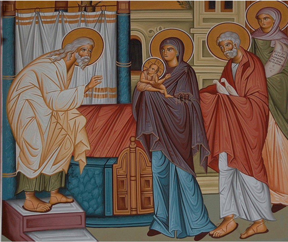
Δίκαιος Συμεών ο Θεοδόχος και Άννα η Προφήτιδα

Εορτάζει στις 3 Φεβρουαρίου εκάστου έτους.