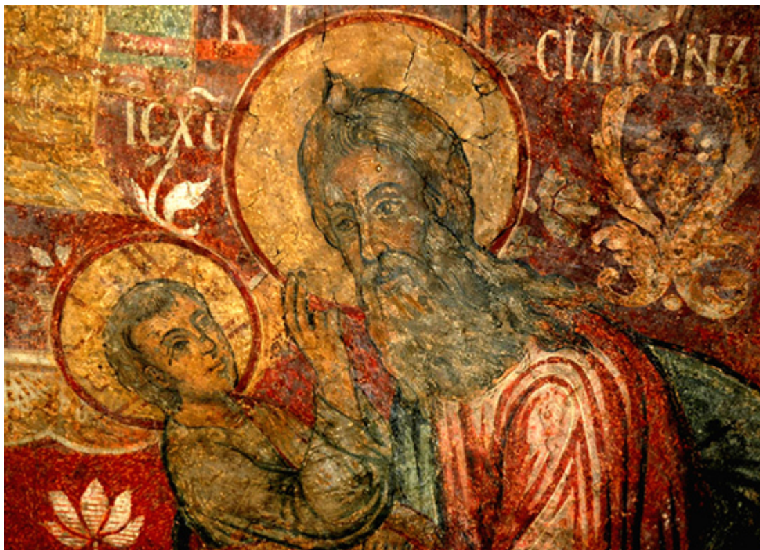
Δίκαιος Συμεών ο Θεοδόχος