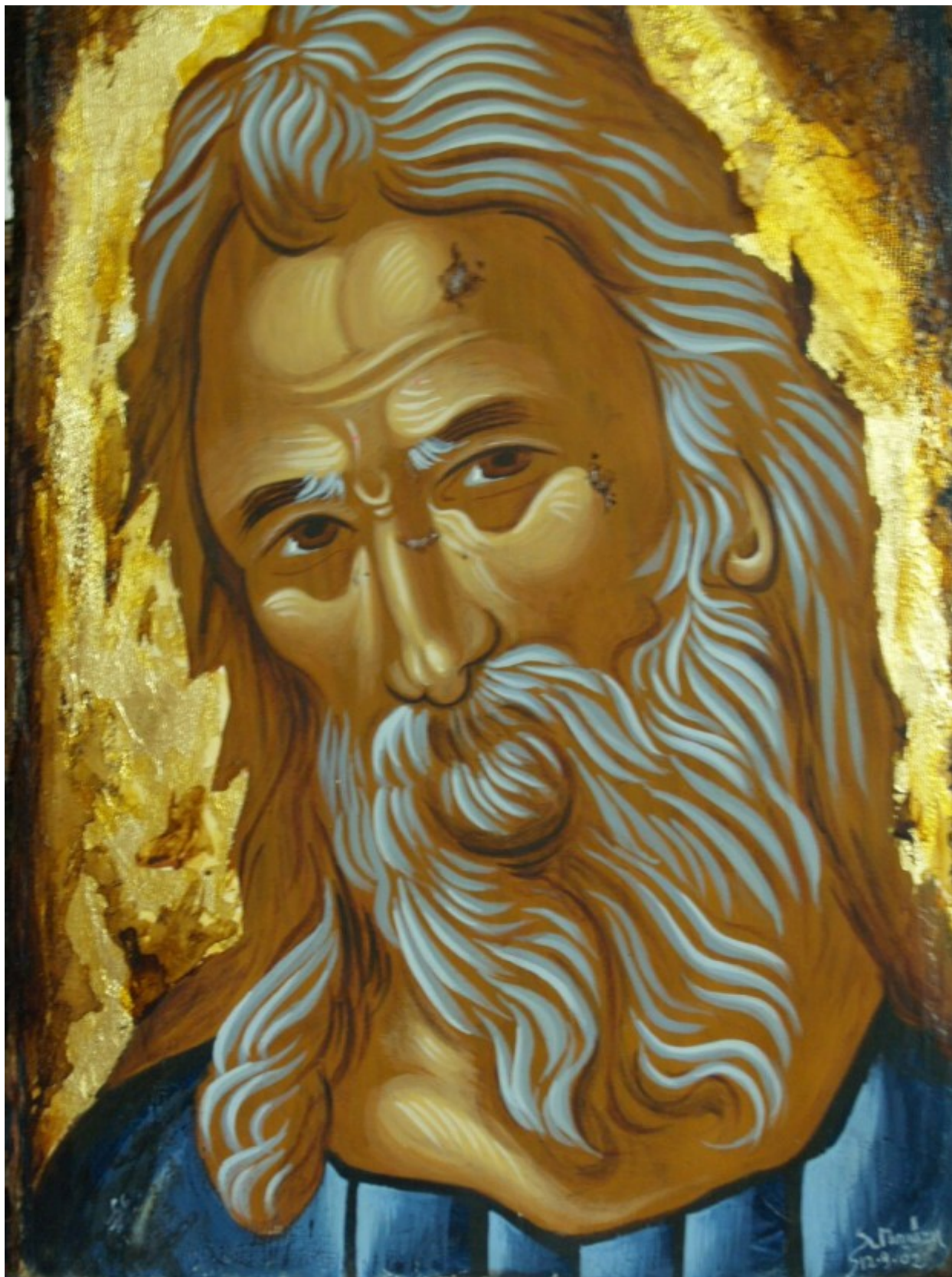
Δίκαιος Συμεών ο Θεοδόχος - Λυδία Γουριώτη© ( http://lydiagourioti-iconography.blogspot.com )