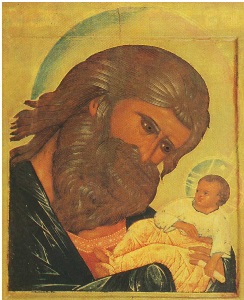
Δίκαιος Συμεών ο Θεοδόχος