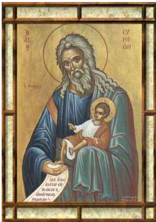
Δίκαιος Συμεών ο Θεοδόχος