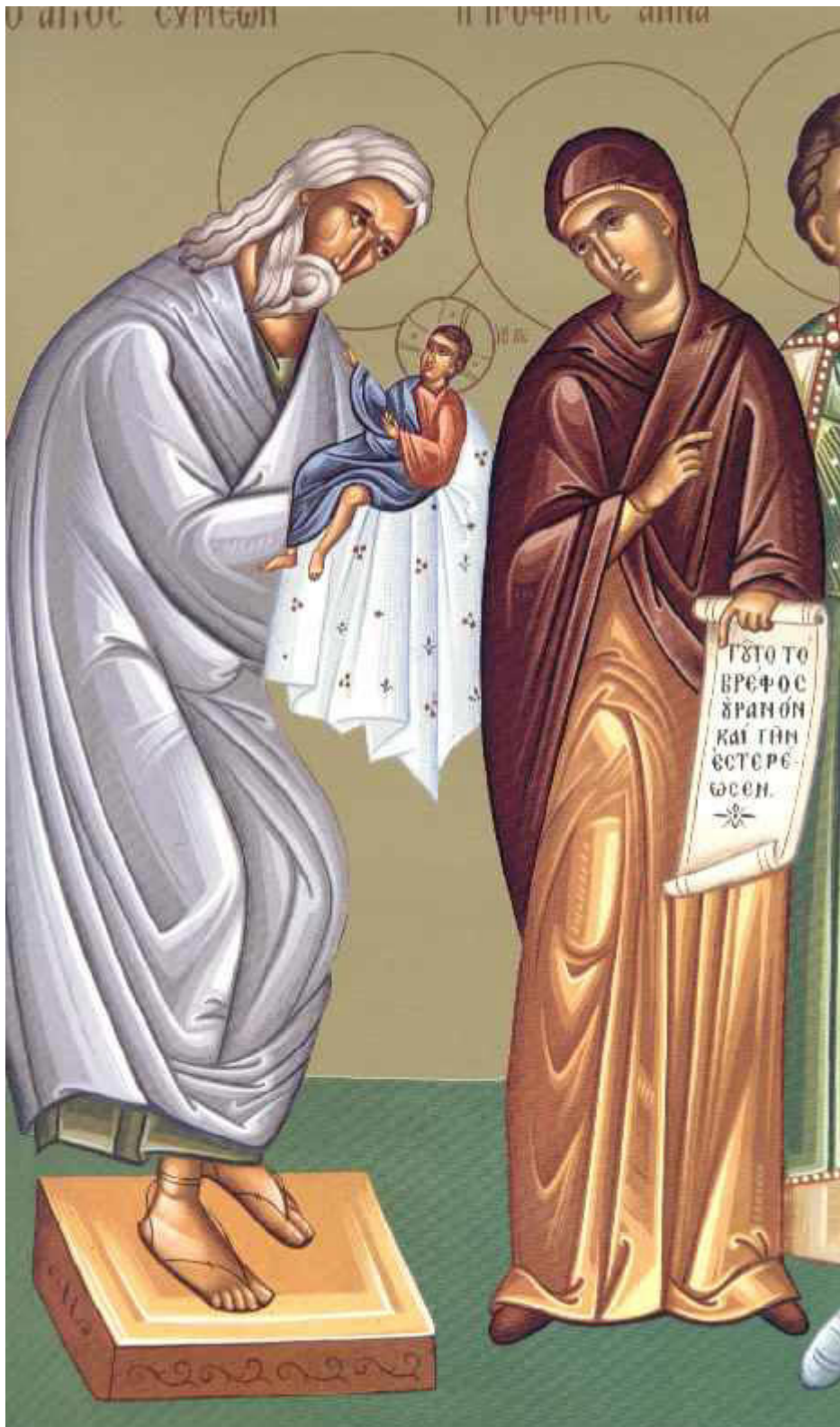
Δίκαιος Συμεών ο Θεοδόχος και Άννα η Προφήτιδα