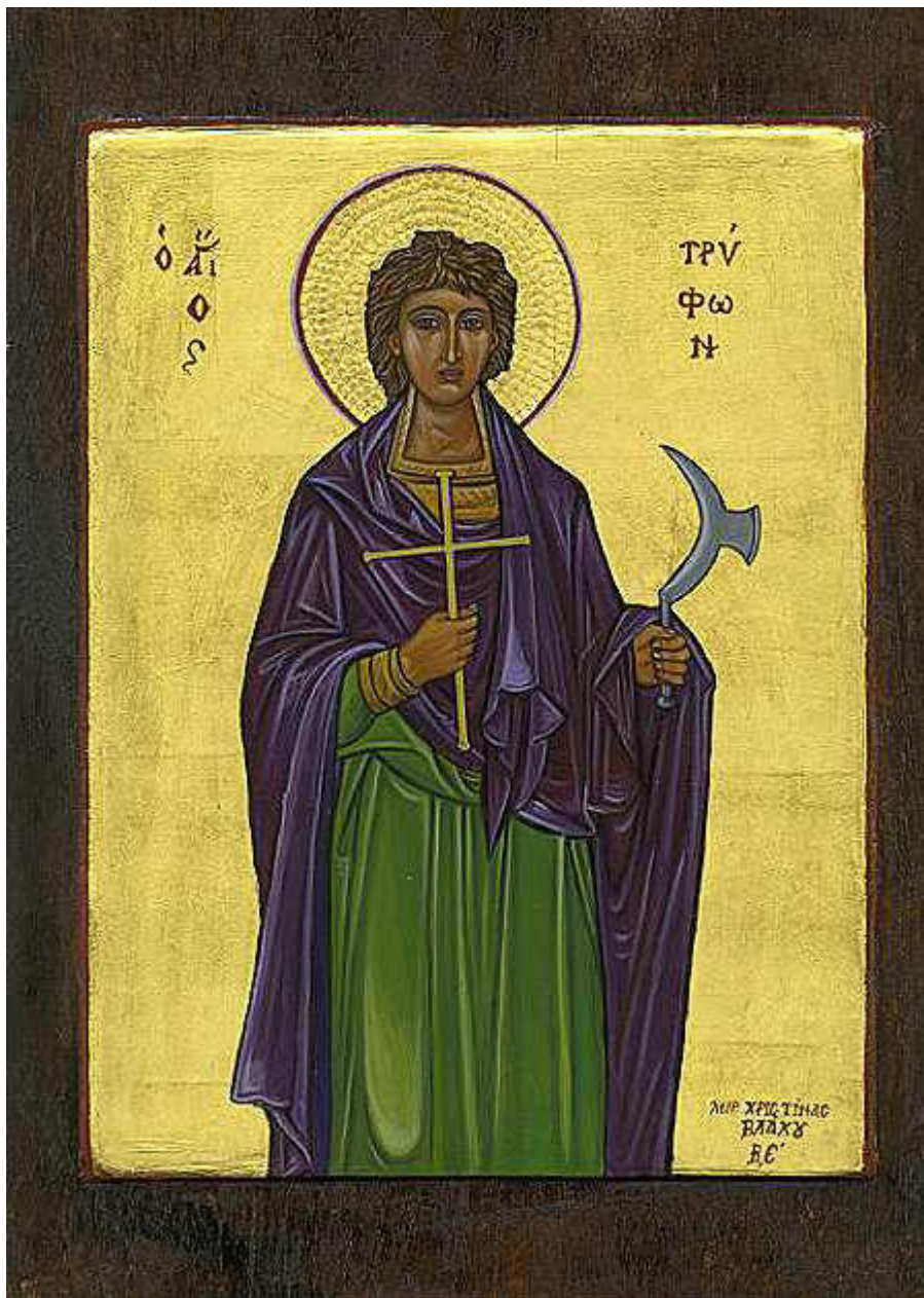
Άγιος Τρύφων ο Μάρτυρας - ΧΡΙΣΤΙΝΑ ΓΕΩΡΓΙΟΠΟΥΛΟΥ - ΒΛΑΧΟΥ© ( www.pigizois.net/xristina/xristina.htm )