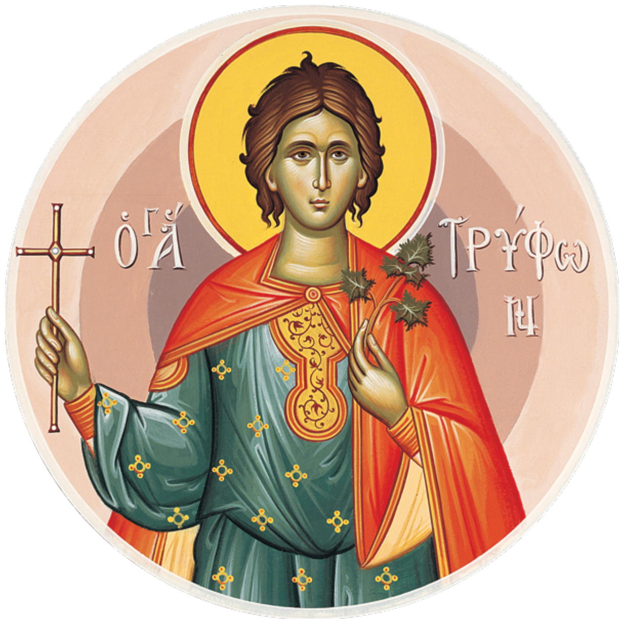
Άγιος Τρύφων ο Μάρτυρας