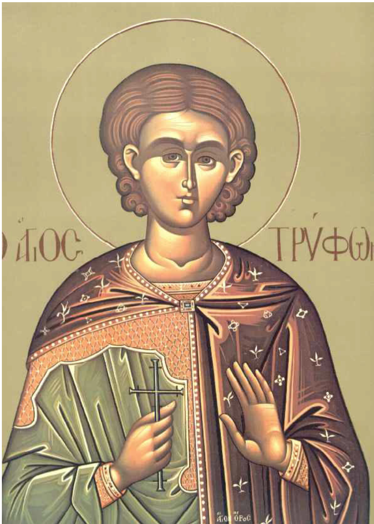
Άγιος Τρύφων ο Μάρτυρας