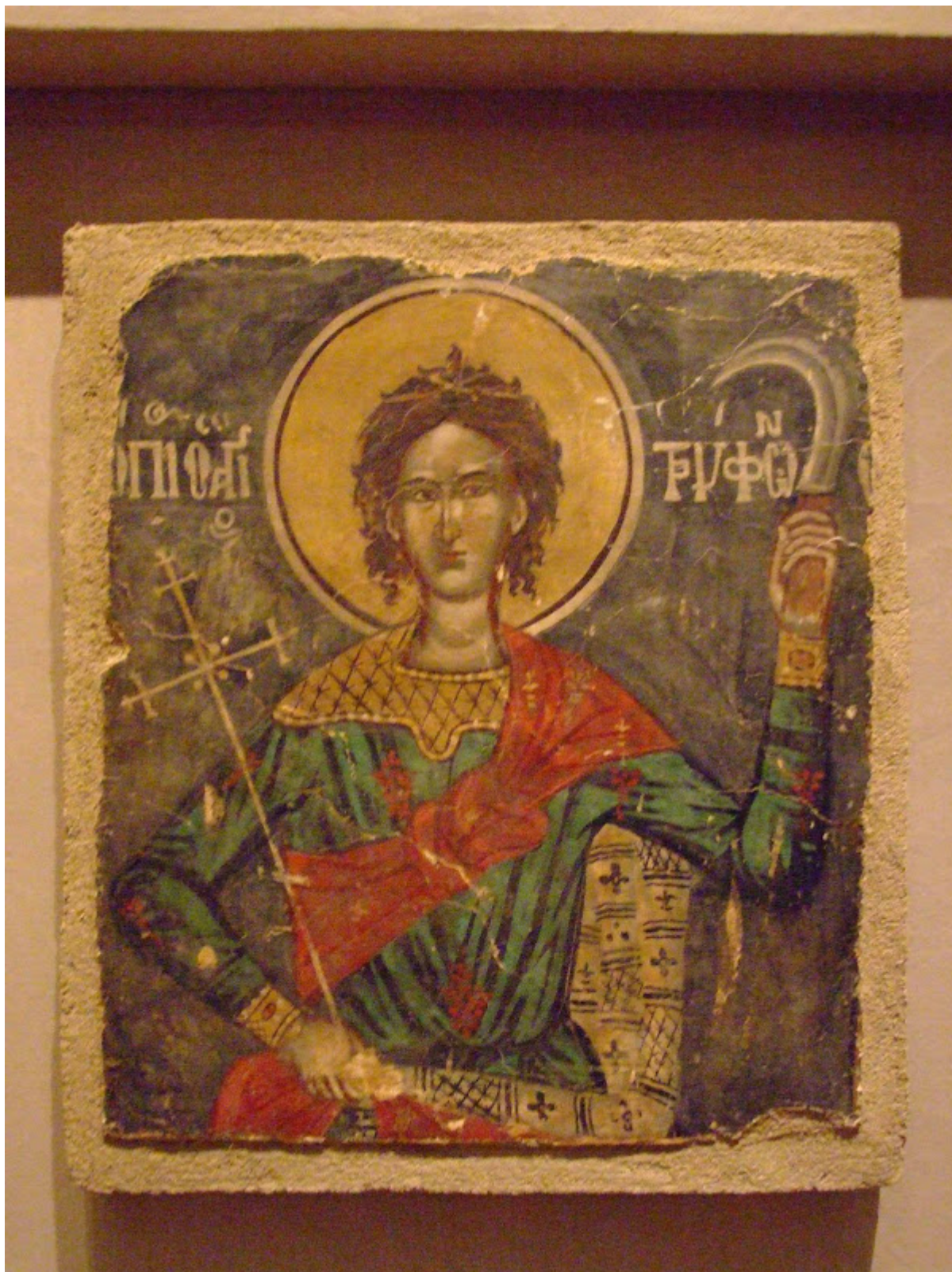
Άγιος Τρύφων ο Μάρτυρας