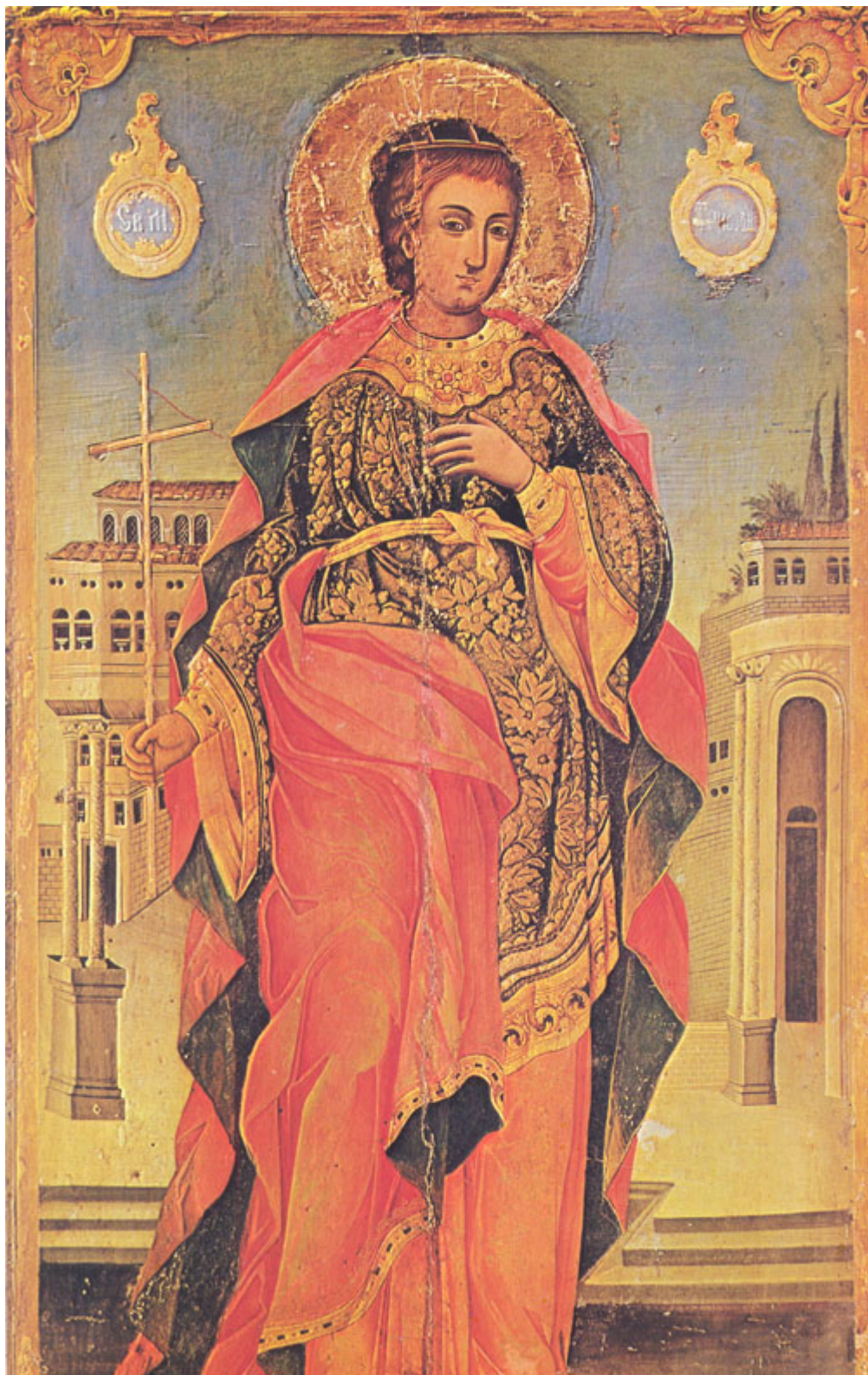
Άγιος Τρύφων ο Μάρτυρας