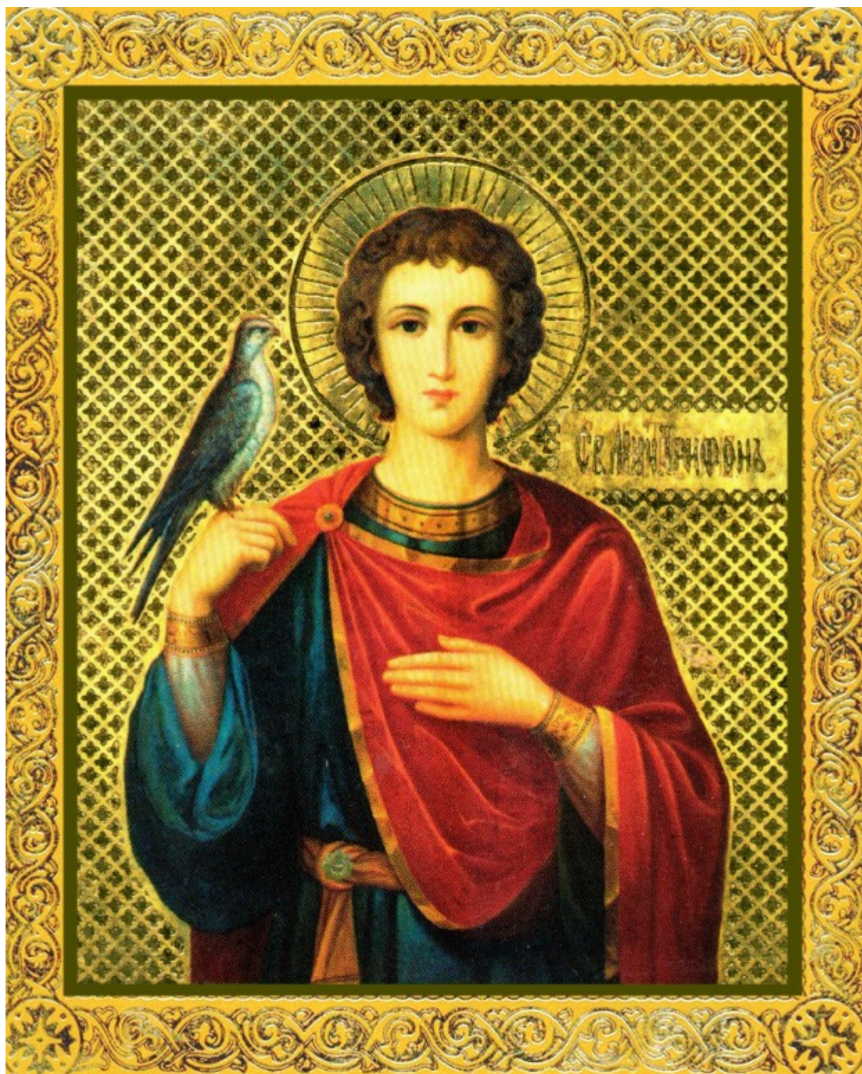
Άγιος Τρύφων ο Μάρτυρας - Στην Ρωσία ο Άγιος Τρύφωνας θεωρείται ο προστάτης των πουλιών.