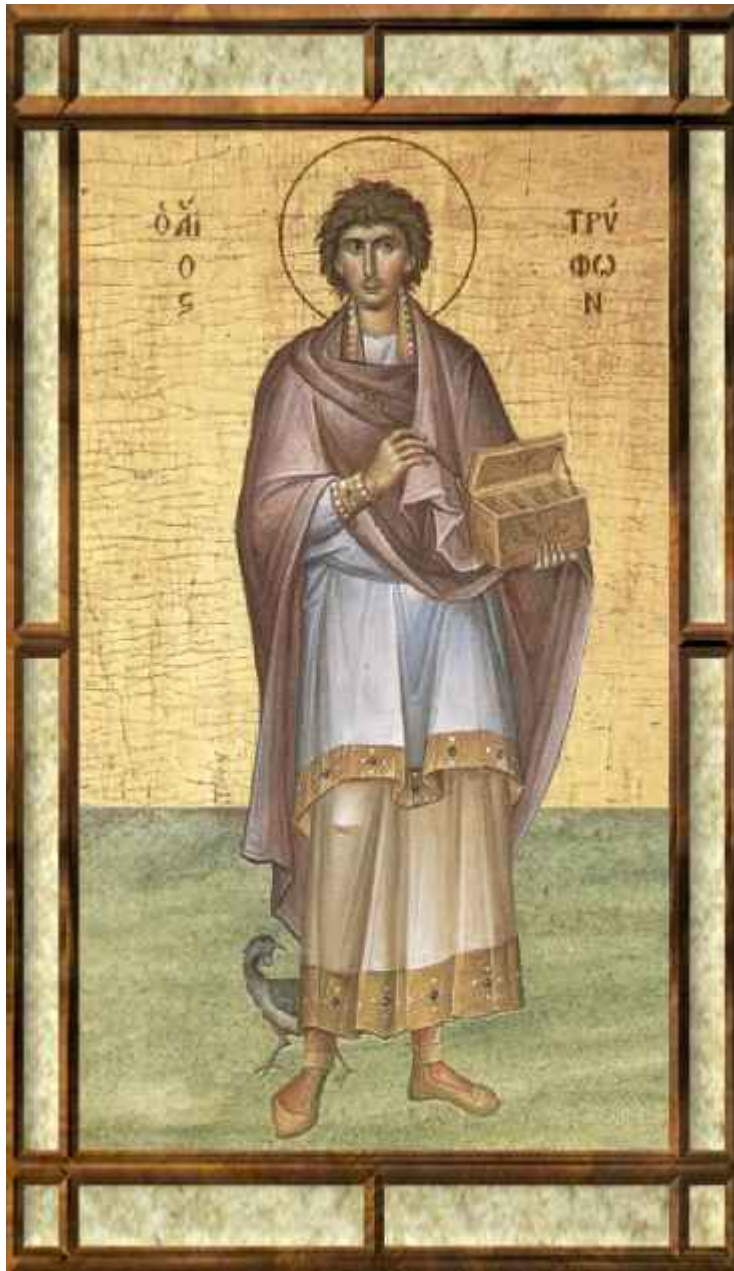
Άγιος Τρύφων ο Μάρτυρας