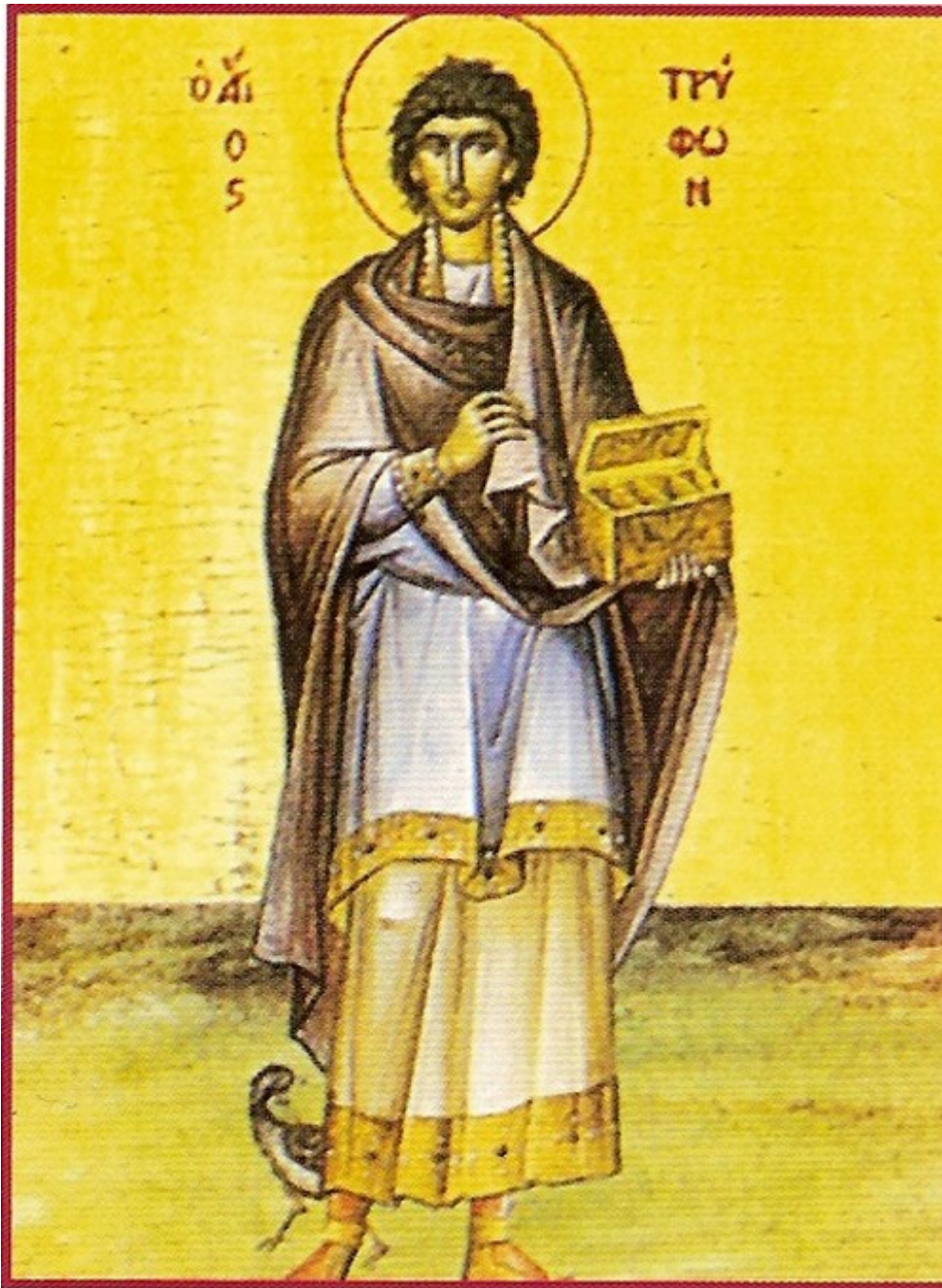
Άγιος Τρύφων ο Μάρτυρας - Ο άγιος Τρύφων εικονίζεται ως Ανάργυρος. Αν και δεν ήταν γιατρός, ο άγιος συμπεριλαμβάνεται στην ομάδα των αγίων Αναργύρων, λόγω του μεγάλου θαυματουργικού χαρίσματος που είχε ήδη όταν ζούσε, ιδιαίτερα κατά των δαιμόνων.