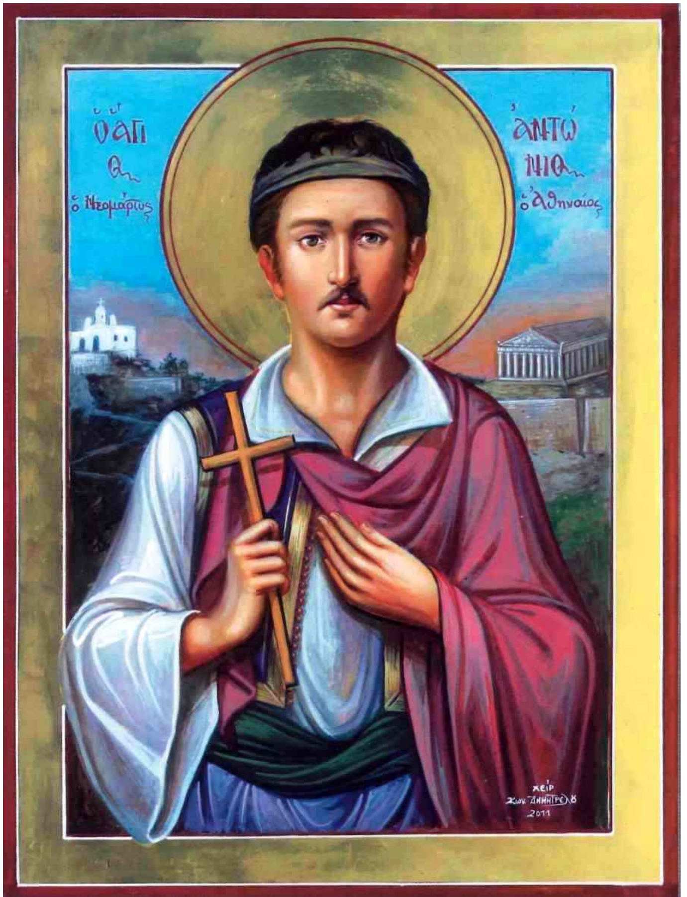
Μαρτύρησε στην Κωνσταντινούπολη στις 5 Φεβρουαρίου το 1774