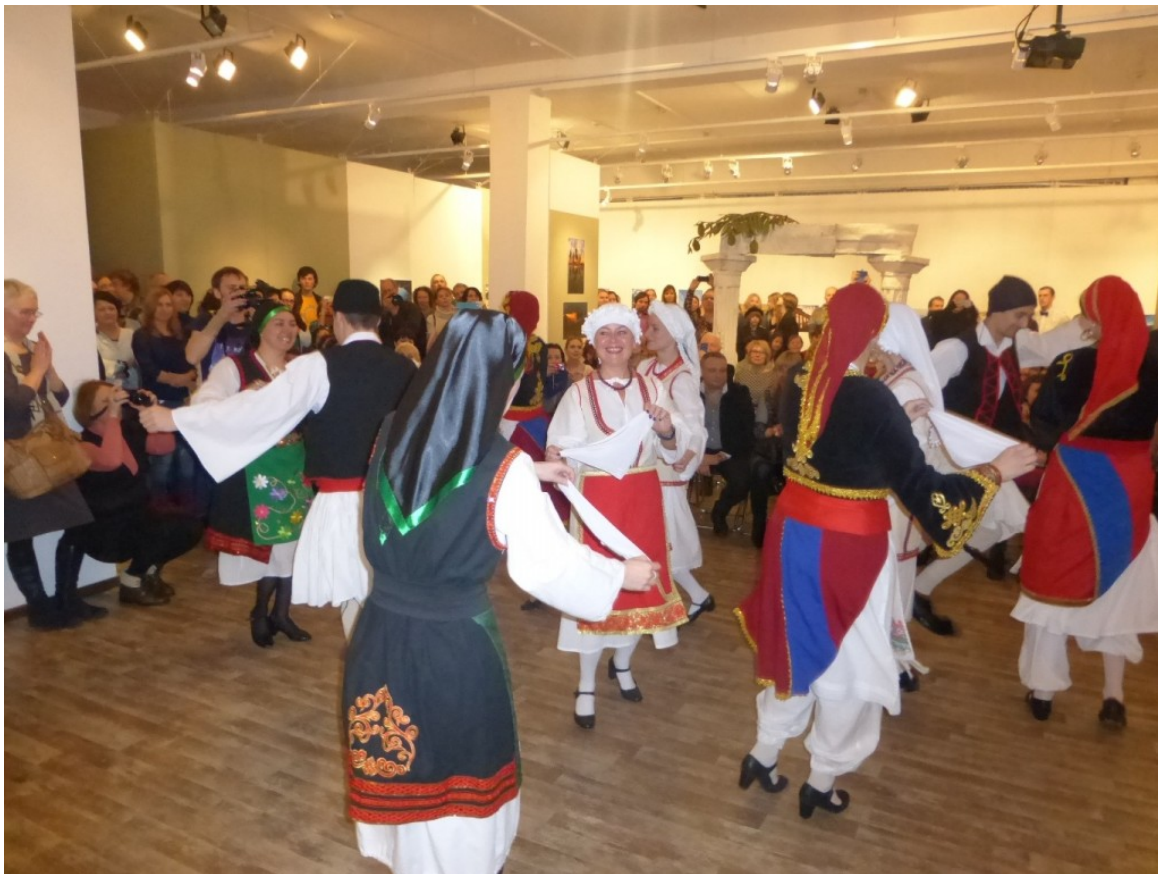
Από τα εγκαίνια της έκθεσης, http://www.elru2016.gr/el/content/aroma-elladas-stin-mosha

Στα πλαίσια εκδηλώσεων του Αφιερωματικού Έτους Ελλάδας - Ρωσίας 2016, πραγματοποιείται στη Μόσχα έκθεση φωτογραφίας με τίτλο «Ελλάδα: Στιγμές προσωπικής ευτυχίας».