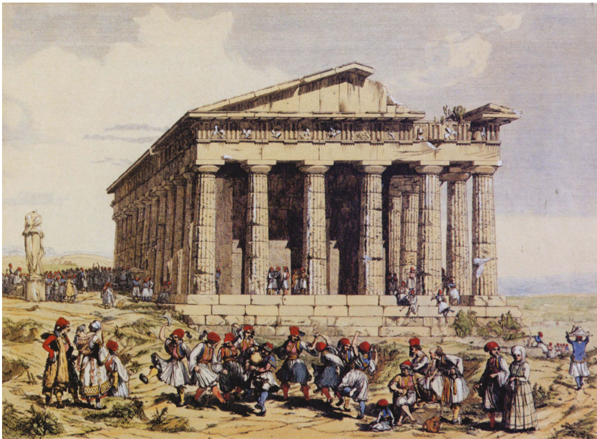
Andrea Gasparini, Σκηνές καθημερινής ζωής στο Θησείο, 1842 (Επιχρωματισμένη χαλκογραφία. Ευγενής δανεισμός του Μουσείου της Πόλεως των Αθηνών).

Το Εθνικό Αρχαιολογικό Μουσείο φέρνει στο φως αναρίθμητες ιστορίες της Αθήνας, που καταγράφηκαν στις εντυπώσεις των Ευρωπαίων περιηγητών, συμπληρώθηκαν από τις πρώτες ανασκαφές του ελληνικού κράτους και περιλαμβάνονται στη νέα περιοδική του έκθεση «Ένα όνειρο ανάμεσα σε υπέροχα ερείπια... Περίπατος στην Αθήνα των περιηγητών, 17ος- 19ος αιώνας», σε συνεργασία με τη Βιβλιοθήκη της Βουλής των Ελλήνων.