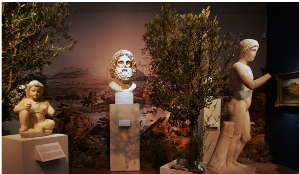
Άποψη της περιοχής του Ιλισού στη νέα περιοδική έκθεση του Εθνικού Αρχαιολογικού Μουσείου.

Τις Κυριακές 14, 21 και 28 Φεβρουαρίου, 13, 20 και 27 Μαρτίου και 10, 17 και 24 Απριλίου, ώρα 12.00, οι αρχαιολόγοι και οι επιμελητές της έκθεσης αναλαμβάνουν να ταξιδέψουν τους επισκέπτες του Μουσείου στις θαυμάσιες πτυχές της άγνωστης Αθήνας.