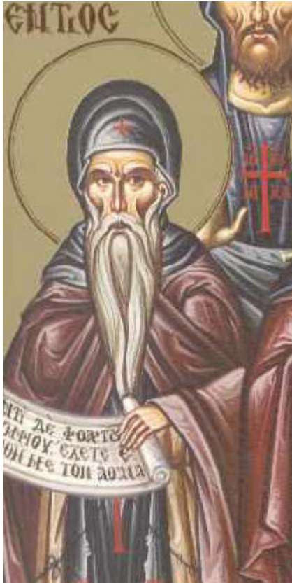
Όσιος Αυξέντιος ο εν τω Όρει

Εορτάζει στις 14 Φεβρουαρίου εκάστου έτους.