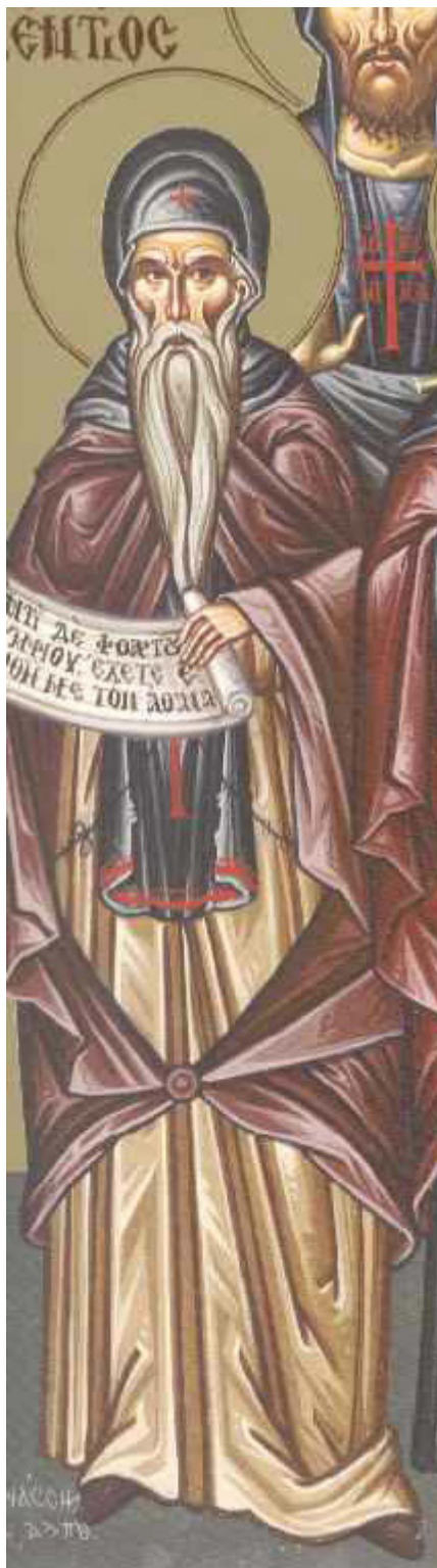
Όσιος Αυξέντιος ο εν τω Όρει