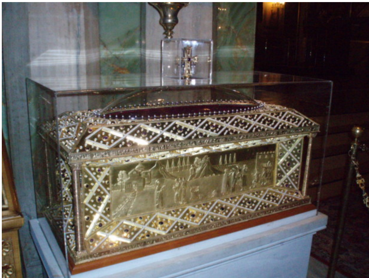
Η ασημένια λειψανοθήκη της Αγίας Φιλοθέης (Μητροπολιτικός Ναός - Αθήνα)