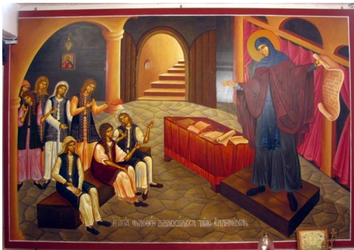
Η Αγία Φιλοθέη διδάσκει τις Ελληνίδες