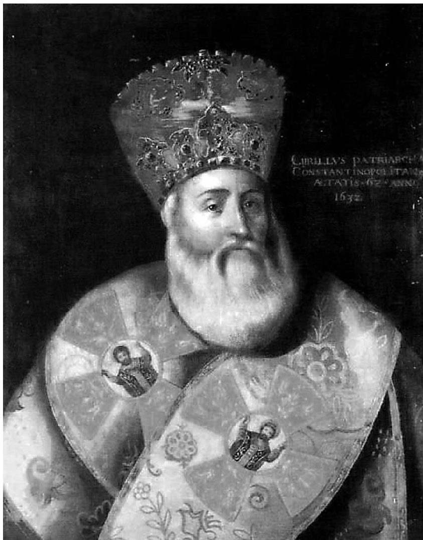
Ο Πατριάρχης Κύριλλος Λούκαρις

Πεμπτουσία: Γιατί αυτά τα δύο κείμενα τα θεωρούμε σημαντικά και σήμερα; Τι έχουν να προσφέρουν στον Έλληνα του εικοστού πρώτου αιώνα;