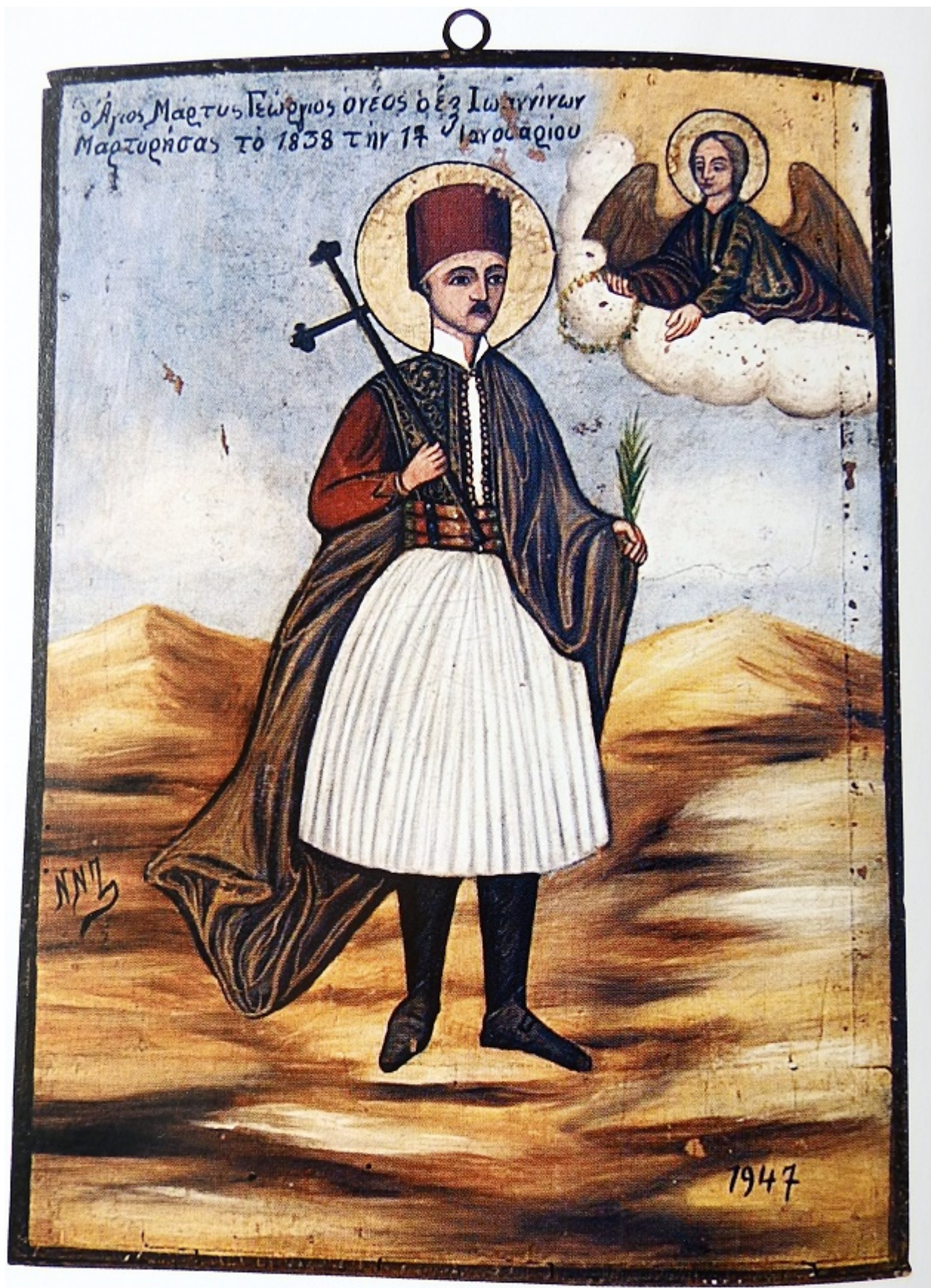
Εικ. 9 Νεόφυτος Ν. Ζωγράφος, Ο Άγιος Γεώργιος ο Νεομάρτυρας, 1947, ναός Αγ. Λαζάρου Λάρνακα

Ο αγιογράφος ο Νεόφυτος, περιοδεύει σε όλη σχεδόν την Κύπρο για 60 περίπου χρόνια, μέχρι τα βαθιά γεράματά του και κοσμεί τέμπλα και προσκνητάρια τόσο