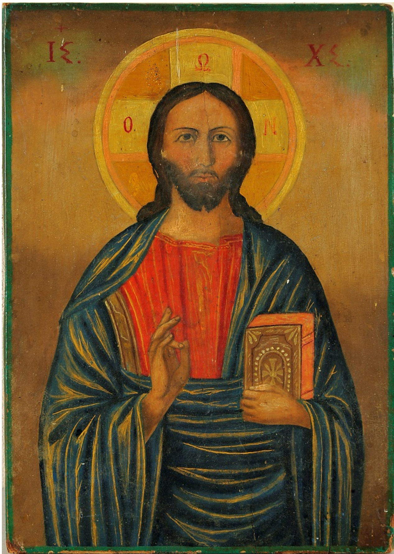
Εικ. 12 Νεόφυτος Ν. Ζωγράφος, ΙΣ ΧΣ, ναός Αγ. Μαρίας, Τερσεφάνου

Τα έργα του Νεόφυτου Ζωγράφου πέραν των πολλών ατελειών και σχεδιαστικών