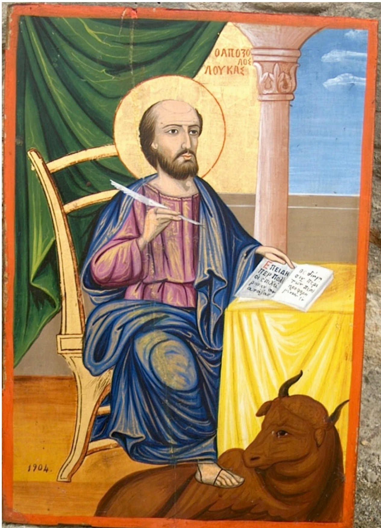
Εικ. 11 Νεόφυτος Ν. Ζωγράφος, Ο Αγ. Λουκάς, 1904, ναός Αγ. Μαρίας, Αναλύντας

Οι λαϊκότερες και απλοϊκές εικόνες του Ζωγράφου μεταδίδουν στον προσκυνητή