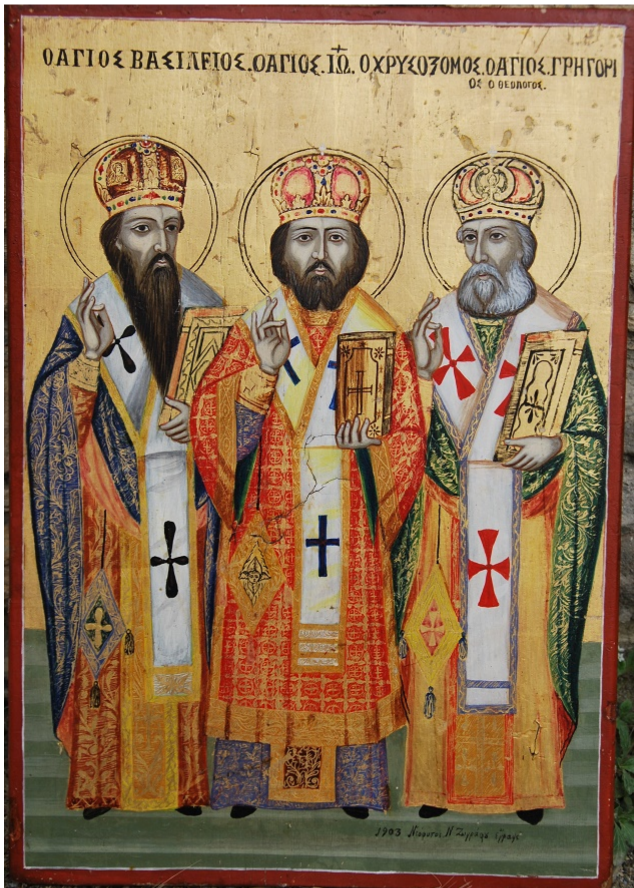
Εικ. 8 Νεόφυτος Ν. Ζωγράφος, Οι τρεις Ιεράρχαι, ναός Αγ. Μαρίας Αναλύοντας

Αγόραζε τακτικά εφημερίδα την οποία και διάβαζε στους συγχωριανούς του στο