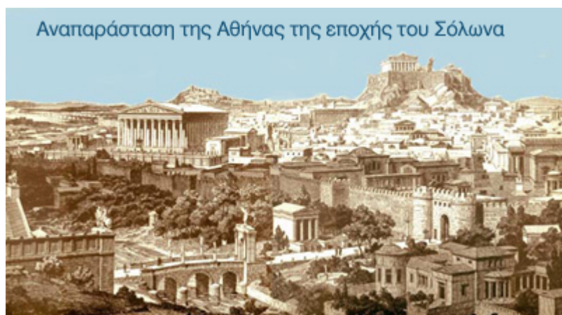
Αναπαράσταση της Αθήνας της εποχής του Σόλωνα

εδώ στον τόπο, μπρος στο αγρίεμα τρέμοντας