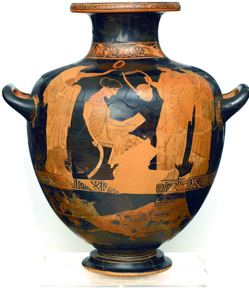
Αττική ερυθρόμορφη υδρία (αρ.κατ. ΕΑΜ 1260). Η ποιήτρια Σαπφώ, καθισμένη, διαβάζει από τον κύλινδρο (βιβλίων) κάποιο ποίημά της, στις τρεις φίλες-μαθήτριες που την πλαισιώνουν. Από τη Βάρη, της Ομάδας του Πολυγνώτου (440-430 π.Χ.)

Το Εθνικό Αρχαιολογικό Μουσείο, η Γενική Γραμματεία Ισότητας, η Εθνική Λυρική Σκηνή και το Κέντρο Ερευνών για Θέματα Ισότητας, διοργανώνουν το Σάββατο 5 Μαρτίου εκδήλωση, ενόψει της Παγκόσμιας Ημέρας της Γυναίκας (8 Μαρτίου).