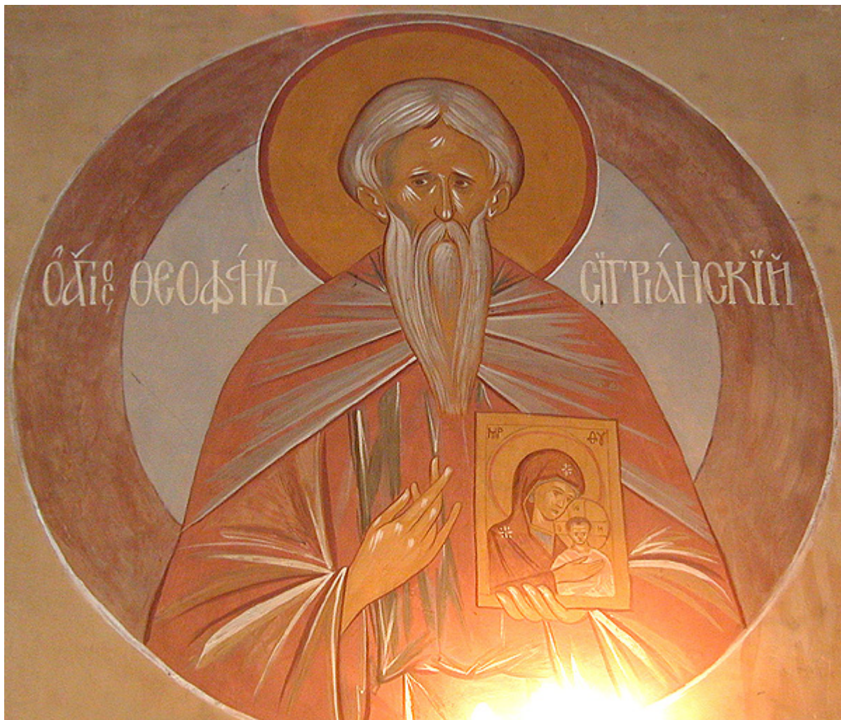
Όσιος Θεοφάνης ο Ομολογητής της Συγριανής