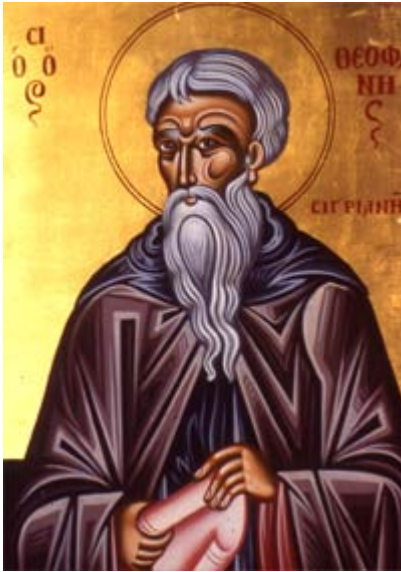
Όσιος Θεοφάνης ο Ομολογητής της Συγριανής