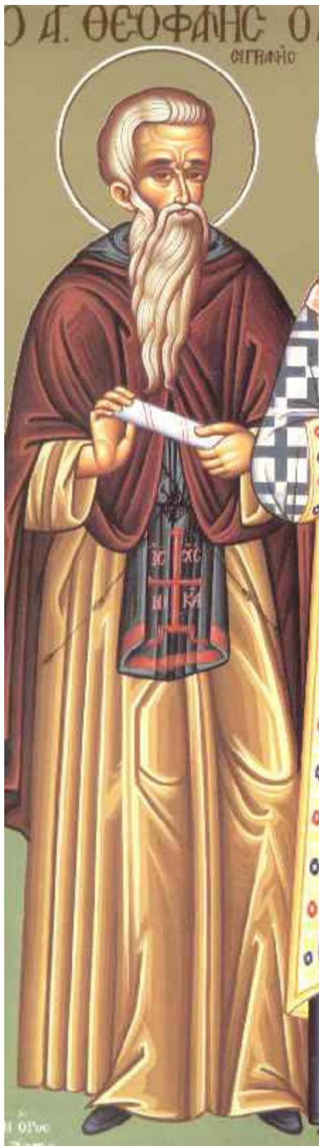
Όσιος Θεοφάνης ο Ομολογητής της Συγριανής