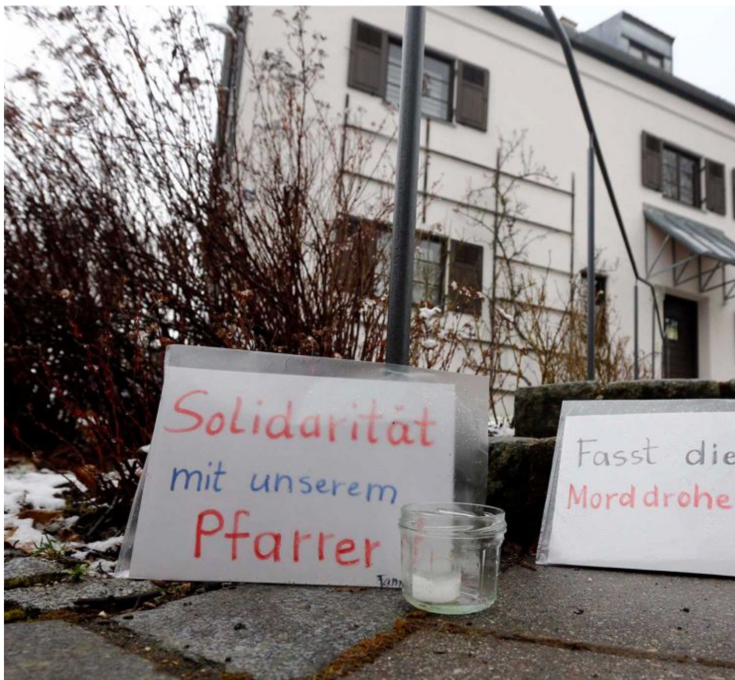
Από τις εκδηλώσεις συμπαράστασης των κατοίκων

Η ρωμαιοκαθολική και η ευαγγελική ενορία της πόλης, ο Δήμαρχος της πόλης και δύο εθελοντικές οργανώσεις που ασχολούνται με πρόσφυγες, διοργάνωσαν στις 9 Μαρτίου 2016 μεγάλη αντιρατσιστική εκδήλωση και διατράνωσαν την μεγάλη τους συμπάθεια στον κογκολέζο καθολικό ιερέα.