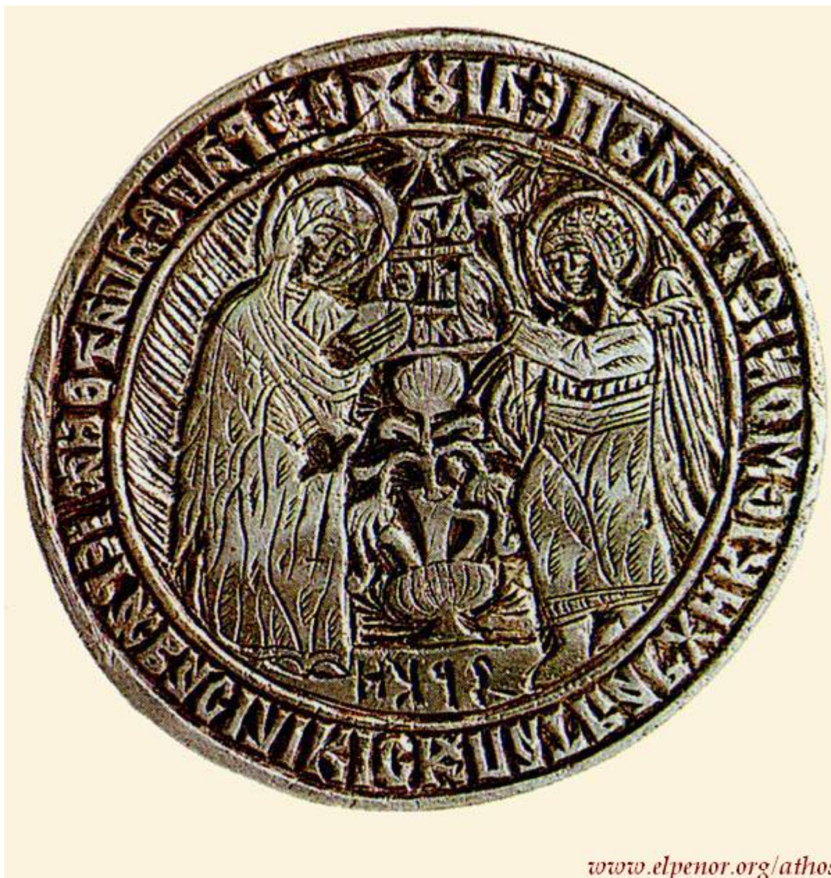
www.elpenor.org/athos Σφραγίδα Μονής Βατοπαιδίου (Η σφραγίδα φέρει στη σφενδόνη την παράσταση του Ευαγγελισμού της Θεοτόκου, στον οποίο είναι αφιερωμένη η Μονή Βατοπαιδίου) - 1620 μ.Χ. - Μονή Βατοπαιδίου, Άγιον Όρος