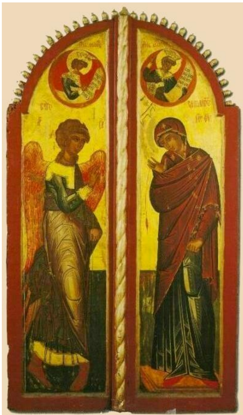
Ευαγγελισμός της Υπεραγίας Θεοτόκου - Βημόθυρα - Ιερό Χιλιανδαρινό Κελλί Μαρουδά, έργο Γεωργίου Μητροφάνοβιτς, 1653/4