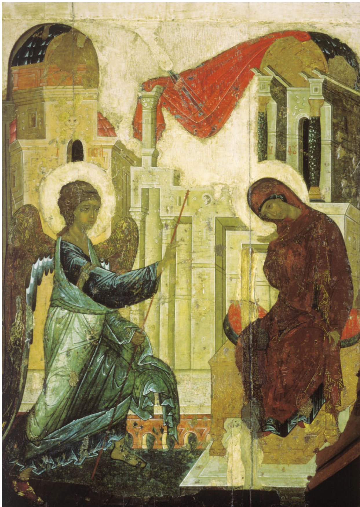
Ευαγγελισμός της Υπεραγίας Θεοτόκου, Αντρέι Ρουμπλιόβ, Ναός του Ευαγγελισμού, 1405