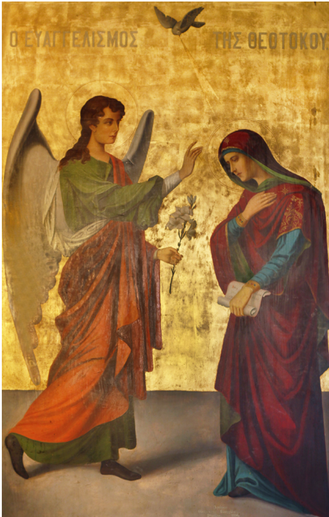
Ευαγγελισμός της Υπεραγίας Θεοτόκου - Ι.Ν. Ζωοδόχου Πηγής, Λαρίσης ( http://www.panagialarisis.gr )