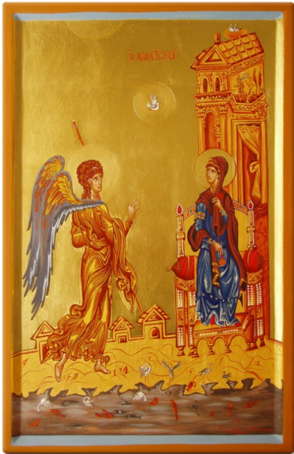
Ευαγγελισμός της Υπεραγίας Θεοτόκου - Πιστό αντίγραφο εικόνας που βρίσκεται στην Μονή Αγίας Αικατερίνης στο Σινά (12ος