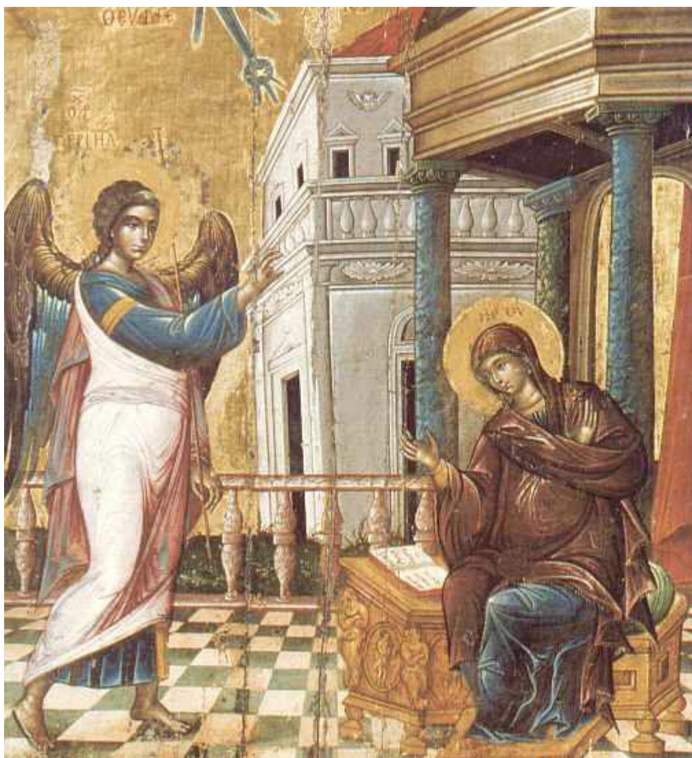
Ευαγγελισμός της Υπεραγίας Θεοτόκου