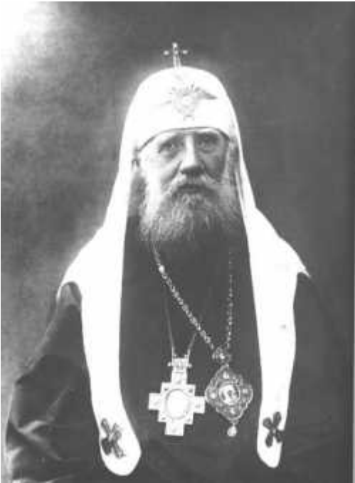
Άγιος Τύχων Πατριάρχης Μόσχας