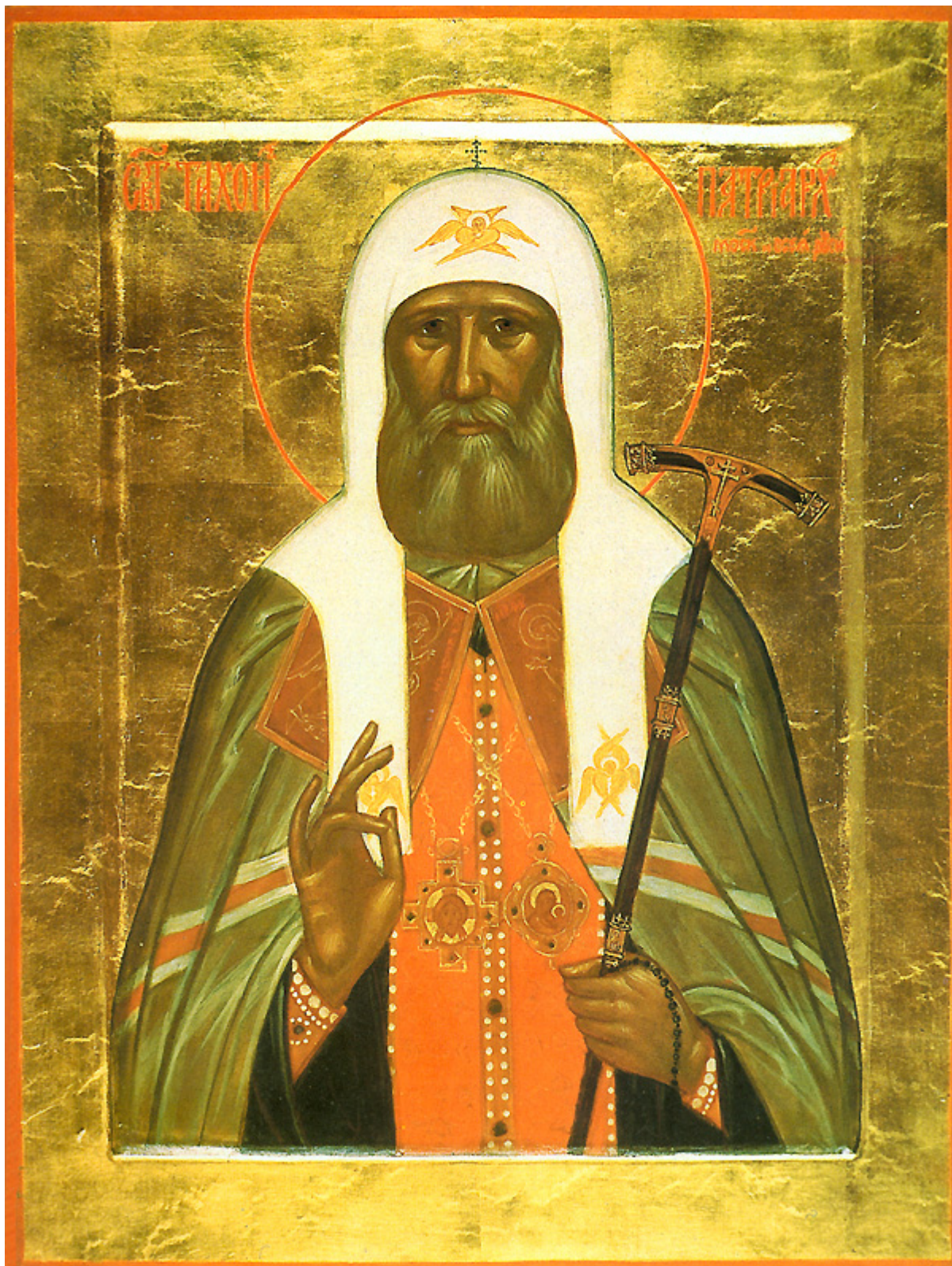
Άγιος Τύχων Πατριάρχης Μόσχας

Τη αυτή ημέρα, μνήμη του οσίου πατρός ημών Τύχωνος, πατριάρχου Μόσχας και πάσης Ρωσίας.