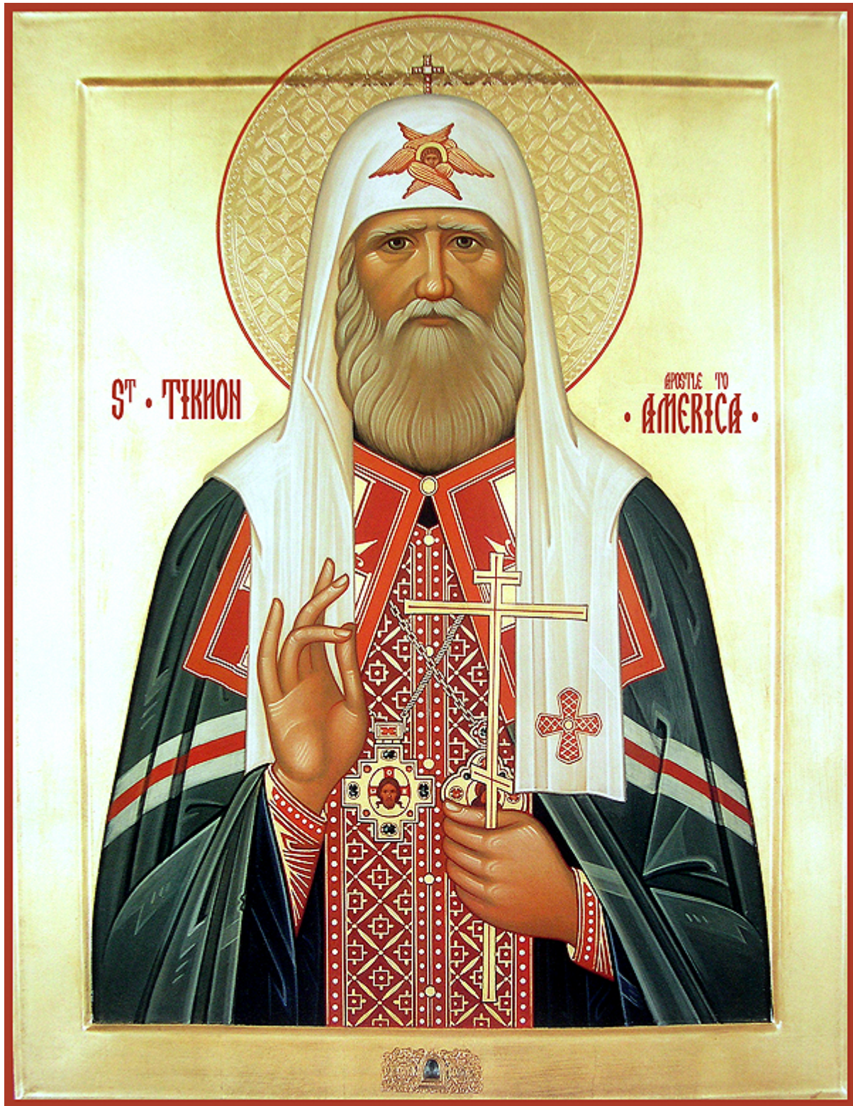
Αγιος Τύχων Πατριάρχης Μόσχας