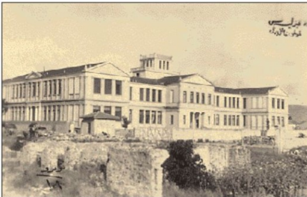
Το νέο κτίριο της περιφημής Ευαγγελικής Σχολής, που υπήρξε το καύχημα των εκπαιδευτικών ιδρυμάτων της Σμύρνης.

Μεγάλο πνευματικό κέντρο η Σμύρνη του Μικρασιατικού Ελληνισμού, εφάμιλλο της Κων/πολης έχει να επιδείξει μια τεράστια παράδοση πνευματικής και πολιτιστικής δημιουργίας από την περίοδο της Τουρκοκρατίας. Μεγάλοι διαφωτιστές και δάσκαλοι του Γένους γεννήθηκαν και έδρασαν στη Σμύρνη, όπως ο Αδαμάντιος Κοραής, ο Ιωάννης Κούμας, ο Ιάκωβος Μοισιόδακας κ.ά. Σπουδαία εκπαιδευτήρια, πολιτιστικά κέντρα με ασύγκριτη εθνική προσφορά αναπτύχθηκαν και λειτούργησαν στη Μικρασία και αυτό οφείλεται κατά κύριο λόγο στον πρωτοφανή ζήλο που επέδειξε ο Ελληνισμός της περιοχής. Η Ευαγγελική Σχολή, το Φιλολογικό Γυμνάσιο Σμύρνης, η Ιωνική Σχολή, η Εμπορική Σχολή, το Κεντρικό Παρθεναγωγείο, Σχολές ιδιωτικής εκπαίδευσης, τα ορφανοτροφεία, πολλά νυχτερινά σχολεία. Τέλος, το επιστέγασμα της εκπαιδευτικής προσπάθειας το Ιωνικό πανεπιστήμιο. Ολα αυτά είναι ο εκπαιδευτικός πλούτος της πρωτεύουσας του Μικρασιατικού Ελληνισμού «της πόλης των Ελλάδων», όπως αναφώνησε ο Γάλλος δημοσιογράφος Rene Rivaux.