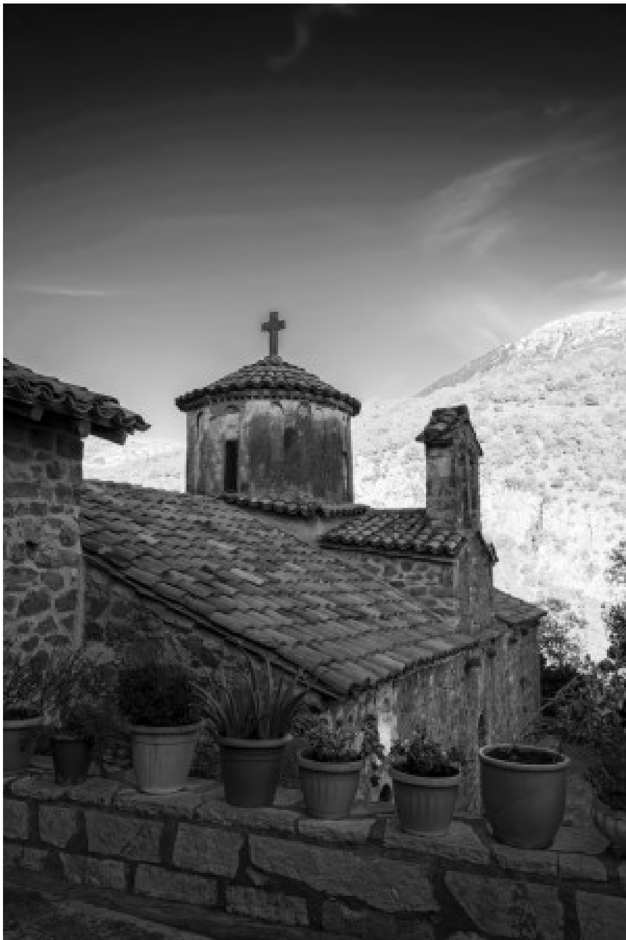
The New Philosophou Monastery was founded in 1691. The monastery with the remarkable carven