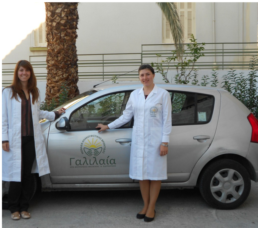
Έτοιμοι για την κατ' οίκον επίσκεψη

Δημητρίου 23, Σπάτα, εντός του Ιερού Προσκυνηματος Αναστάσεως Χριστού. (Πληροφορίες στην ιστοσελίδα www.galilee.gr και στο τηλέφωνο 210 6635955).