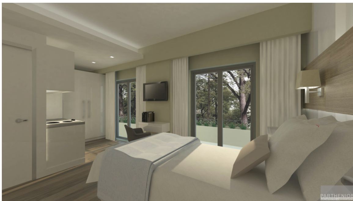
Δωμάτιο Ξενώνα, Fotorealístico

Επίσης, λειτουργεί δύο φορές την εβδομάδα Κέντρο Ημερήσιας Φροντίδας και Απασχόλησης, όπου συνδυάζεται η ανακουφιστική φροντίδα και υποστήριξη με δημιουργική απασχόληση των περιπατητικών ασθενών μέσω διαφόρων δραστηριοτήτων.