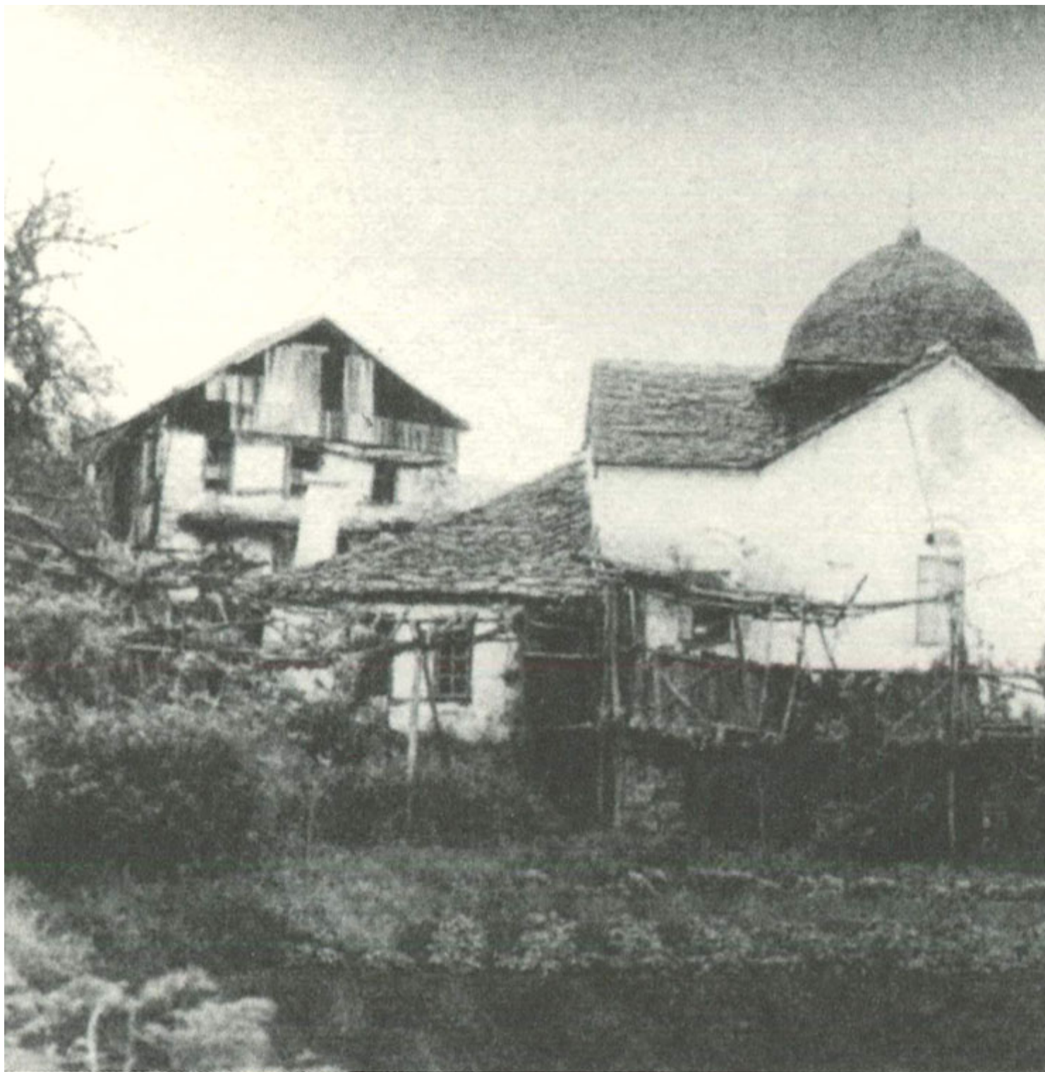
Το Κελλί του Αγίου Γεωργίου του Φανερωμένου, στην Παντοκρατορινή Καψάλα