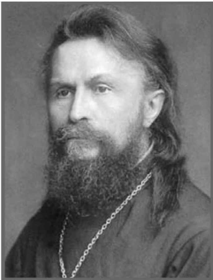
Σέργιος Μπουλγκάκωφ (1871-1944)

Μετά την επικράτηση των μπολσεβίκων και βεβαίως του διαλεκτικού υλισμού στην Ρωσσία του 1917 πολλοί Ρώσοι διανοητές, καθηγητές ρωσικών πανεπιστημίων και αξιόλογοι συγγραφείς, εξαναγκάστηκαν να καταφύγουν στις χώρες της Δυτικής Ευρώπης, κυρίως στην Γερμανία (Βερολίνο) και στην Γαλλία (Παρίσι), αλλά και στην Αμερική.