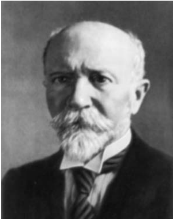
Νικόλαος Λόσσκυ (1870-1960)

Την πατρώα γη αναγκάστηκε να εγκαταλείψει το 1922 ο καθηγητής της φιλοσοφίας στο Πανεπιστήμιο της Αγίας Πετρούπολης Νικόλαος Λόσσκυ (1870-1960), στο έργο του οποίου αναγνωρίζονται επιρροές από τον Λάϊμπνιτς (1646-1716) και τον Λότσε (1817-1881). Από τα πολλά έργα που εξέδωσε στην Δύση ο Λόσσκυ θα αναφερθούν τα εξής: «Η ελευθερία της βούλησης» (Παρίσι 1927), «Αξία και είναι» (Παρίσι 1931), «Ο Ντοστογιέφσκι και η χριστιανική κοσμοαντίληψή του» (Νέα Υόρκη 1953). Η σημαντική «Ιστορία της ρωσικής φιλοσοφίας» του Ν. Λόσσκυ έχει μεταφραστεί στην γαλλική (Παρίσι 1954) και στην αγγλική (Νέα Υόρκη 1951).