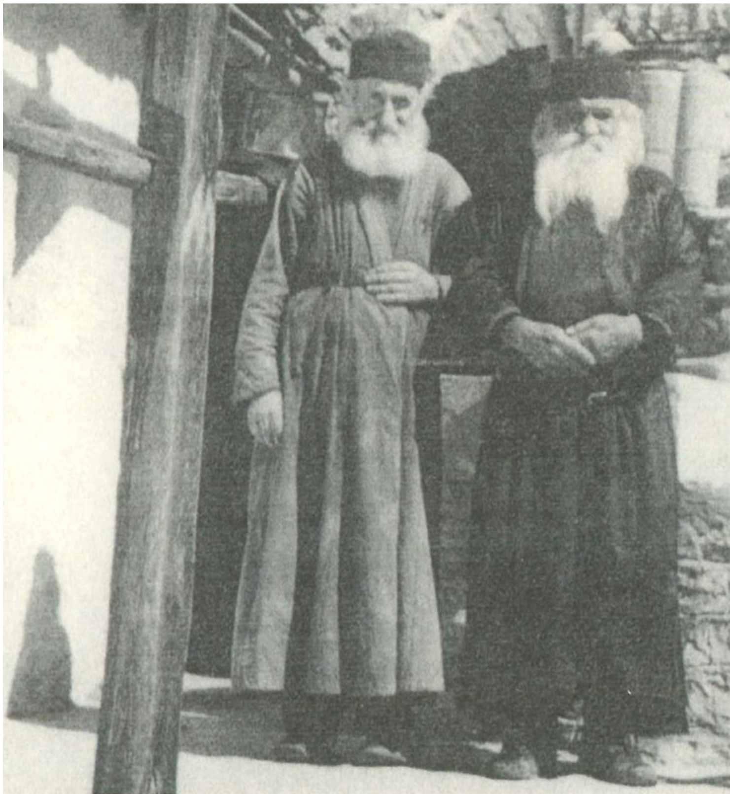
Ο μακάριος Γέροντας Χριστόδουλος Κατουνακιώτης (δεξιά), με τον εκλεκτό υποτακτικό του μα

Γεννήθηκε στη Λαμία το 1894 ο κατά κόσμο Χρηστός Κοντονικολός. Νέο τον βρίσκουμε τσαγκάρη στη Χαλκίδα. Δεκάχρονος είχε μείνει ορφανός από πατέρα. Η καλή του μητέρα τον πότισε τα νάματα της ευσέβειας. Κατέληξε τον βίο της ως μεγαλόσχημη μοναχή Μαγδαληνή.