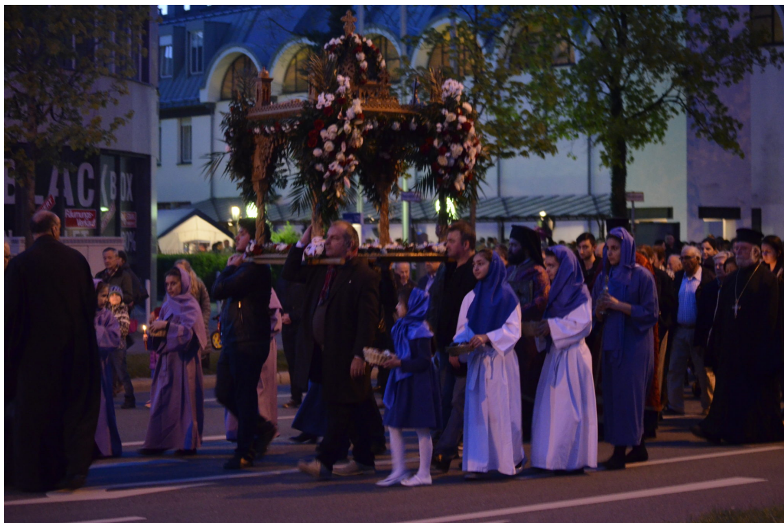
Η Περιφορά του Επιταφίου μπροστά στον ιερό Ναό των Αγίων Πάντων

Η περιφορά του Επιταφίου ξεκίνησε από τον ιερό ναό και πέρασε μπροστά από την κεντρική είσοδο του Βορείου Κοιμητηρίου Μονάχου.