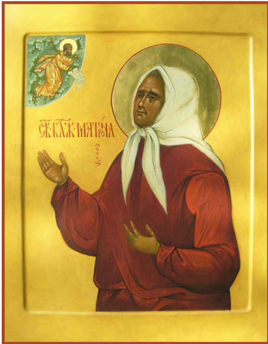
Οσία Ματρώνα εκ Ρωσίας