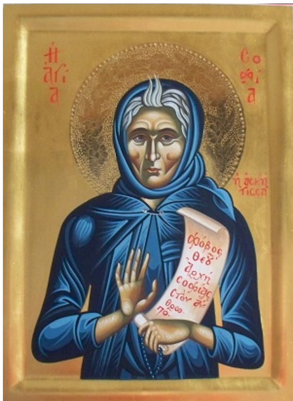
Αγία Σοφία-Φορητή εικόνα 30X40 ἔργο Μαρίας Τοτού 2011

Ο αγιογράφος οφείλει να αγωνίζεται, ζώντας μέσα στην Εκκλησία την όλη εκκλησιαστική ζωή και να εκφράζει μέσα από τα έργα του- έργα αποκαλυπτικά που φανερώνουν τα έσχατα, την χαρά που εκπηγάει από την Ανάσταση του Κυρίου μας και το κάλλος όχι το πρόσκαιρο κι αυτό που τέρπει τις αισθήσεις αλλά το εσχατολογικό. Γι' αυτό και απαρνιέται την φυσιοκρατική απόδοση των σωμάτων «αισθητική εγκράτεια», χρησιμοποιώντας μία ζωγραφική λιτή, αφαιρετική, σχηματοποιημένη, την βυζαντινή τεχνοτροπία, που μας την παρέδωσαν οι πρώτοι κιώλας αγιογράφοι από γενιά σε γενιά, με μικρές διαφοροποιήσεις ανάλογα με το ιστορικό πλαίσιο δράσης τους.