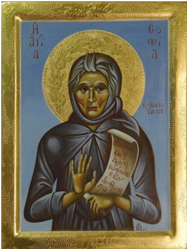
Αγία Σοφία - Φορητή Βυζαντινή εικόνα 2013

Τα σχέδια και οι εικόνες που παρουσιάζονται είναι έργα της Πρεσβυτέρας Μαρίας Τοτού