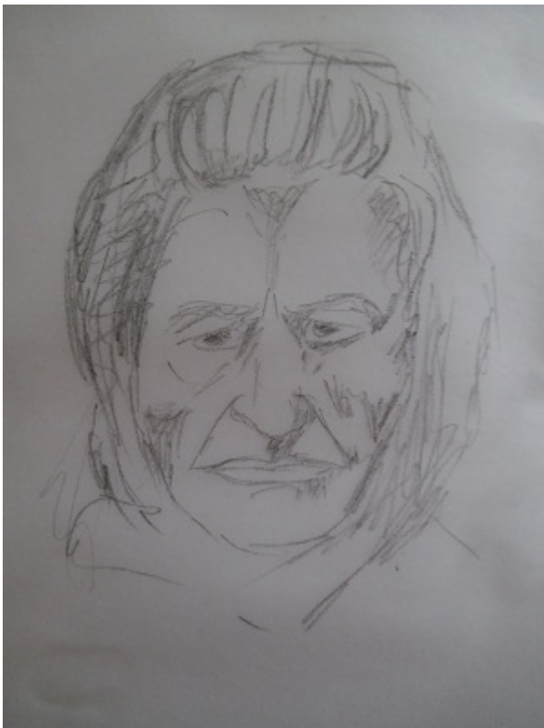
Φυσιοκρατική απόδοση της μορφής Της Αγίας Σοφίας 2011