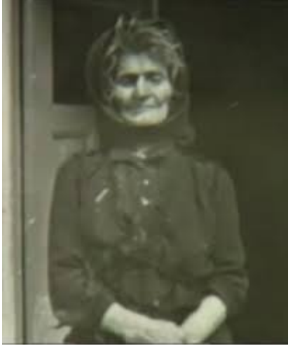
Φωτογραφία της Αγίας Σοφίας

προπλασμό έχει ως αποτέλεσμα «το κομμάτιασμα της μορφής και το στυλιζάρισμα των στοιχείων, που δείχνουν να αυτονομούνται και να αποκτούν ιδιαίτερη εικαστική υπόσταση μέσα στα όρια της μορφής του προσώπου» όπως παρατηρεί και ο Γ. Κόρδης.