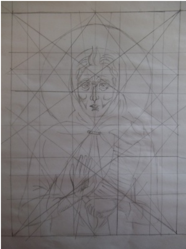
Προσχέδιο με βοηθητικούς άξονες και Χρυσές τομές- έργο Μαρίας Τοτού 2011

Η Βυζαντινή Τέχνη υπηρετεί μία υψηλή αποστολή. Η αγιογραφία δεν είναι μόνο μία καλλιτεχνική δημιουργία αλλά κυρίως μία Θεολογική δημιουργία.