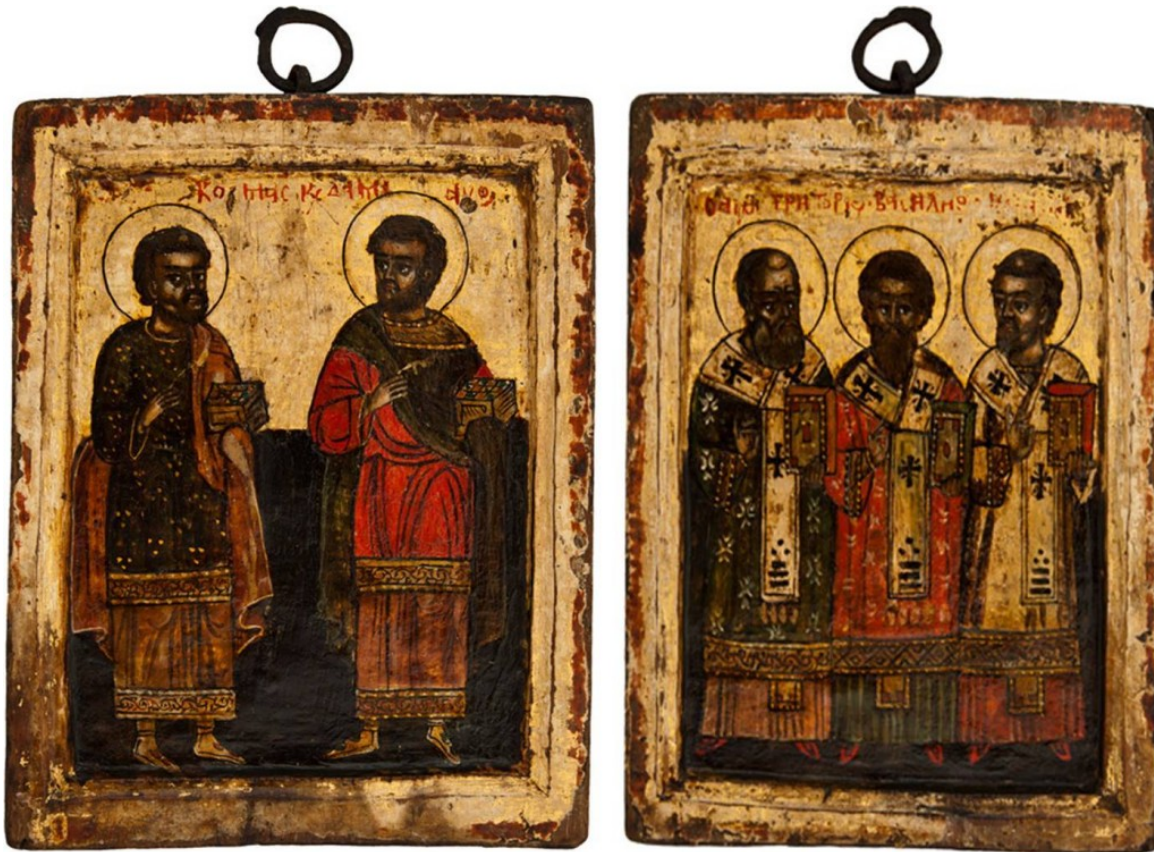
3. Αμφιπρόσωπο εικονίδιο χορού (με τις παραστάσεις των αγίων Αναργύρων και των Τριών Ιεραρχών).

Αμφιπρόσωπο εικονίδιο χορού (με τις παραστάσεις των Αγίων Αναργύρων και των Τριών Ιεραρχών), 18ου αι., διαστ. 0,17Χ0,12μ., που είχε κλαπεί από το ναό Κοίμησης Θεοτόκου Κουκουλίου, Π.Ε. Ιωαννίνων, Περιφέρειας Ηπείρου. Η κλοπή πραγματοποιήθηκε το διάστημα 21-25.12.2009