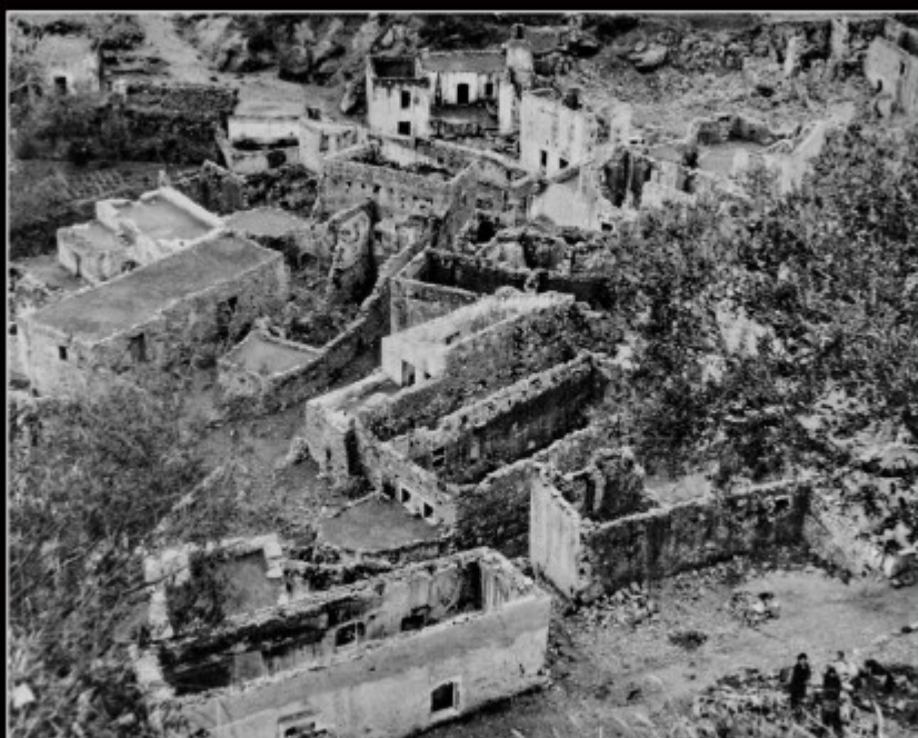
Αρχείο Κουτουλάκη - Δήμος Μαλεβιζίου