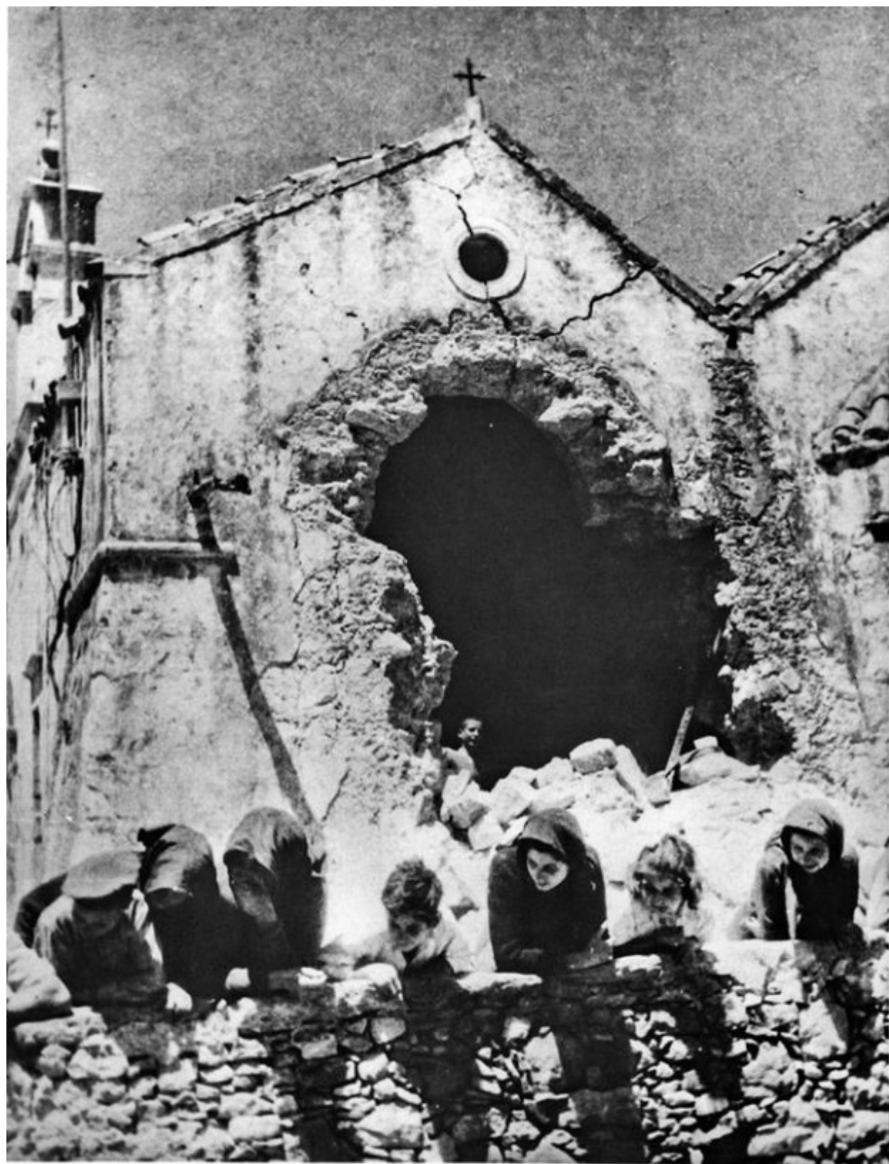
253. Γκρέμιζαν τις ἐκκλησιές, βρώ- μιζαν με τὸ πέρασμά τους, τοὺς ἱε- ροὺς χώρους τῶν μοναστηριῶν.