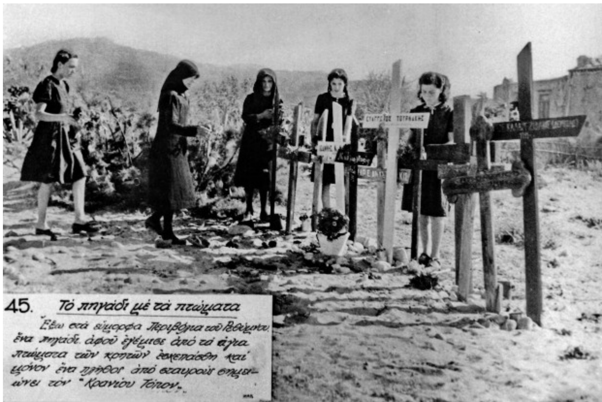
45. Τό πηγάδι μέ τά πτώματα Ἐξω ἐσά εὐμορφά Περιβόρια τοῦ Βεθάνου. ἓνα πηγάδι ἀφοῦ ἐγένετο ἀπό τῆς εἰρή- παισίας τῶν κορηῶν δελεαίῶσι καί ἐξόνον ἓνα πηγάδι ἀπό εὐαγγελίου σημι- ῶνε τόν "Κρανίου Τόπον".