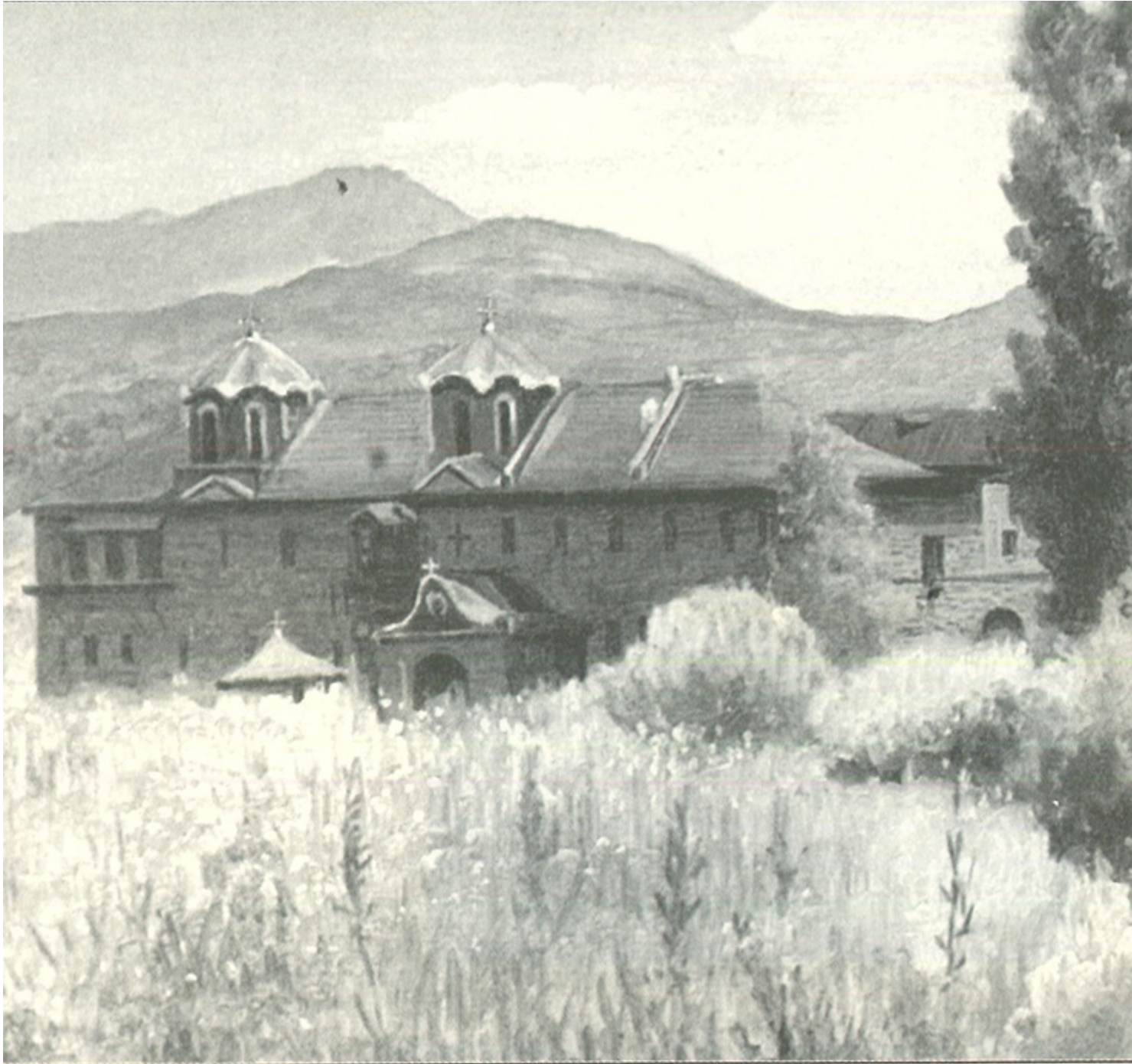
Κουτλουμουσιανό Κελλί Αγίων Αποστόλων

Ήταν 14.3.1984. Λόγω της μακάριος απλότητός του δικαιολογούνται κάποιες αφέλειές του, που ίσως ενοχλούσαν ορισμένους αδελφούς.