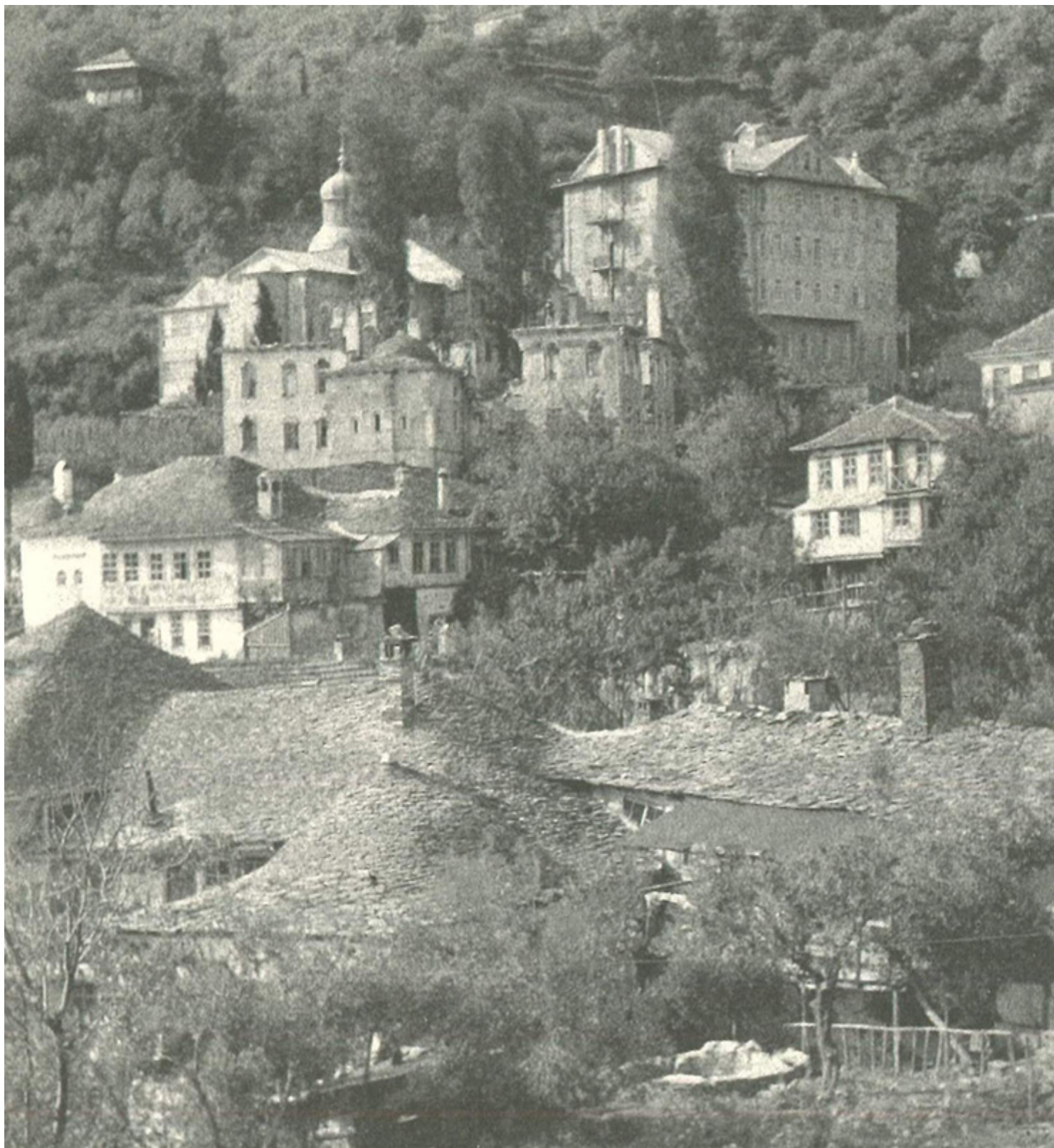
Κελιά των Καρυών (φωτ.1918)

Όπως γράφει ο ιερομόναχος Αναστάσιος Κουτλουμουσιανός: «Όλα του τα χρόνια στη διακονία των ασθενών και των γερόντων. Πέρασε άσημος και έγκλειστος τουλάχιστον είκοσι χρόνια στο Κελλί του. Ποτέ δεν παραπονέθηκε. Ευχαριστούσε τον Θεό και παρακαλούσε να τον σώση δωρεάν, γιατί, τι μπορούσε να κάνει που να