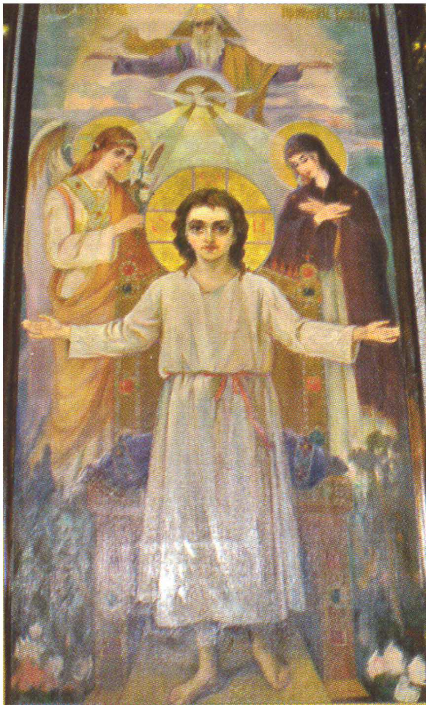
Ο Χριστός ως παιδί, η Σοφία του Θεού. Εικόνα από την Αγία Σοφία στη Σόφια (Βουλγαρία).

Ο Άγιος Ιωάννης ήταν Βούλγαρος στην εθνικότητα και καταγόταν από μια πόλη της Βουλγαρίας η οποία αναφέρεται στο συναξάριο με το όνομα Σούμνα . Το όνομά του στη βουλγαρική γλώσσα είναι Ράϊκος , μεταφράζεται δε στα ελληνικά Ιωάννης. (περισσότερα...)