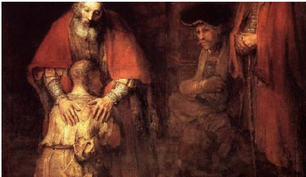
Η επιστροφή του ασώτου

Τον ένα πρόσωπο είναι ο Ιούδας και το άλλο πρόσωπο είναι ο Πέτρος. Φαντάζεστε ότι ο Ιούδας ήταν ένας αναίσθητος και ασυνείδητος ο οποίος εν ψυχρώ πήγε και Τον πρόδωσε. Γιατί αυτοκτόνησε; Αναίσθητοι άνθρωποι δεν αυτοκτονούν. Αν θέλετε ευαίσθητοι αυτοκτονούν. Αλλά η ευαισθησία δεν σημαίνει απαραίτητως προσόν. Ούτε είναι ποιότητα. Μπορεί να είναι ένας εγωισμός εκλεπτυσμένος. Αυτός, λοιπόν, ο άνθρωπος μπαίνοντας σ αυτήν την λογική του μετανοιώματος συχτήρισε τον εαυτό του και είπε: «Έλεος, ρε, συ. Τι έκανα; Για 30 δεκάρες πούλησα Αυτόν με τον οποίο έφαγα ψωμί κι αλάτι για τρία χρόνια. Γιατί; Με ξεχώρισε από τους άλλους; Μου συμπεριφέρθηκε σκάρτα; Και γω πήγα και τον πούλησα για 30 δεκάρες;» Και πνιγμένος μέσα στις εγωιστικές του τύψεις, στις ενοχές που γέννησε στην ψυχή του αυτή η πράξη, οδηγήθηκε σε ένα αδιέξοδο και το αδιέξοδο τον έφερε στην τραγωδία της αυτοκτονίας.