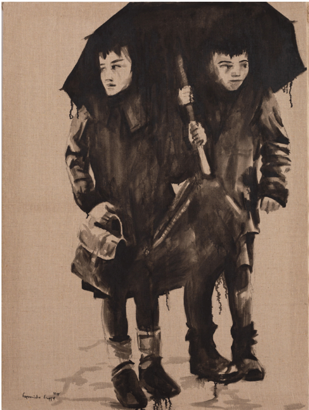
Καλλιτέχνης: Γιώργος Γεροντίδης

Τα Κειμήλια του Μικρασιατικού Ελληνισμού της Κύπρου στο Βυζαντινό Μουσείο και την Πινακοθήκη του Ιδρύματος Αρχιεπισκόπου Μακαρίου Γ΄, λίγες εκατοντάδες μέτρα από τη γραμμή καταπαύσεως του πυρός στην παλιά Λευκωσία, αποτελούν