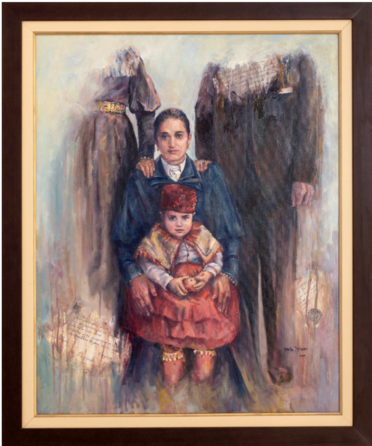
Καλλιτέχνης: Αννέττα Στυλιανού