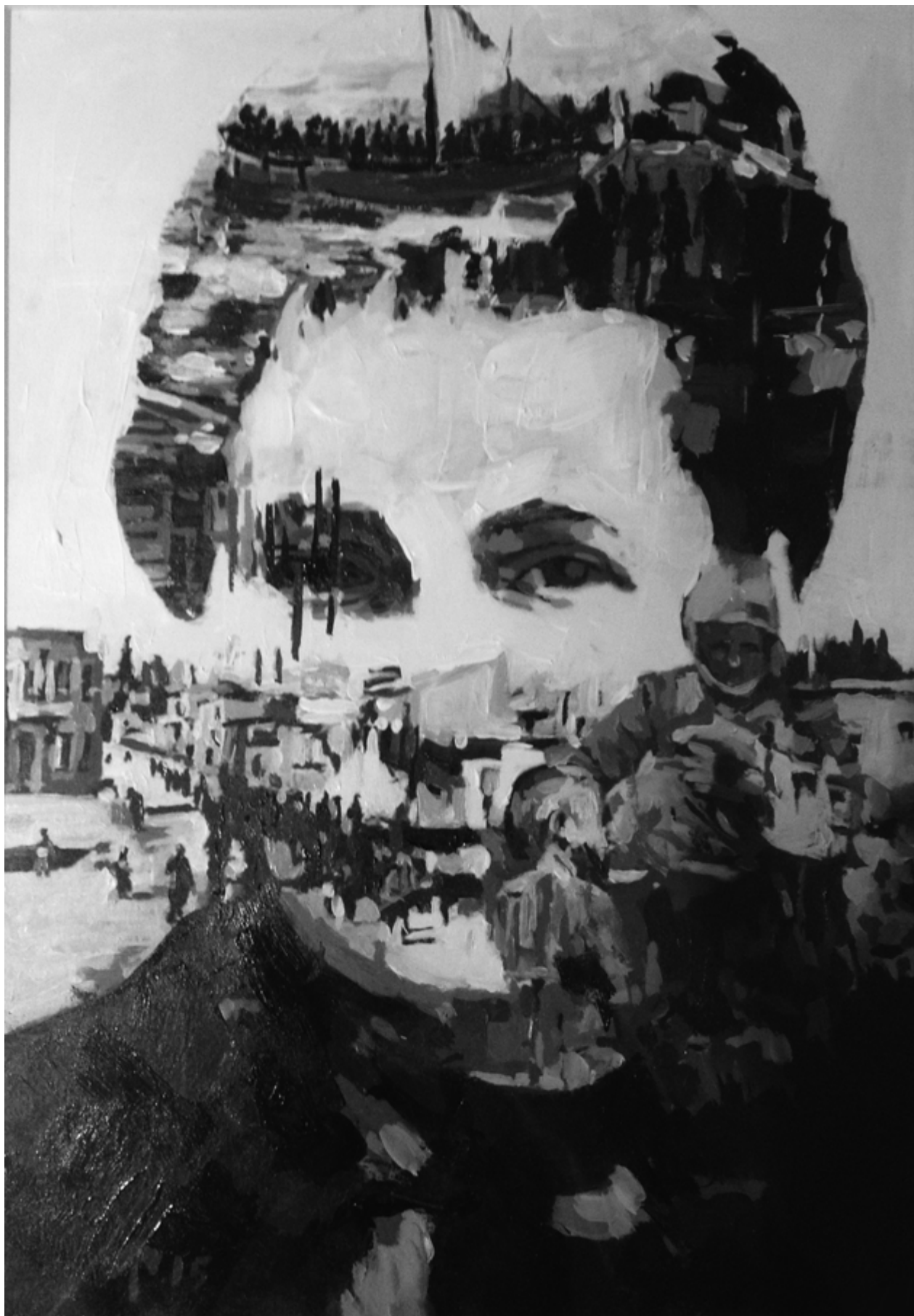
Καλλιτέχνης: Ανδρέα Τόμπλιν