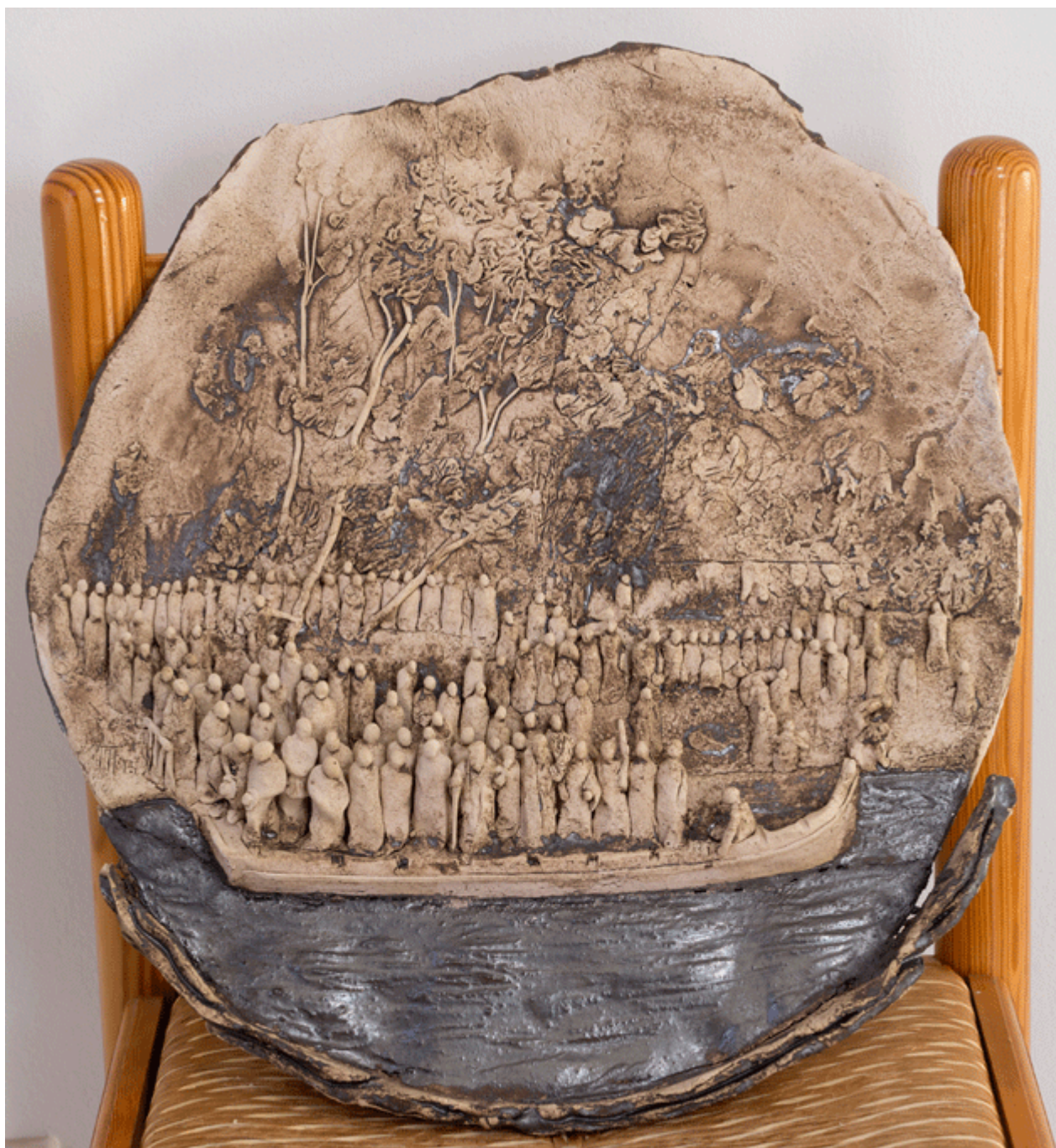
Καλλιτέχνης: Παναγιώτης Πασάντας

Ψυχών» από τη Λία Λαπίθη και Food Performance (γαστρονομικό δρώμενο) με τη Μαριλένα Ιωαννίδου να προσφέρει μικρασιατικό γλυκό σεκερπαρέ.