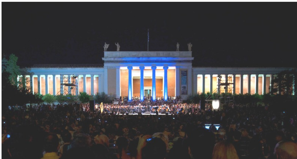
Εθνικό Αρχαιολογικό Μουσείο

Συγκεκριμένα την Τετάρτη 18 Μαΐου, στην Κεντρική Εκδήλωση του Ελληνικού Τμήματος ICOM - Εθνικού Αρχαιολογικού Μουσείου, στις 19.00μ.μ., θα γίνουν ομιλίες σχετικές με το θέμα του εορτασμού, από τον Ομότιμο Καθηγητή Κλασικής Αρχαιολογίας Πέτρο Θέμελη και τη Δρ Μαρία Λαγογιάννη, Διευθύντρια του Εθνικού Αρχαιολογικού Μουσείου. Θα προηγηθεί χαιρετισμός από τον Υπουργό Πολιτισμού και Αθλητισμού Αριστείδη Μπαλτά και την Πρόεδρο του Ελληνικού Τμήματος του ICOM Αλεξάνδρα Μπούνια. Θα ακολουθήσει συναυλία με έργα του Astor Piazzolla, από την Ορχήστρα Σύγχρονης Μουσικής της ΕΡΤ, με σολίστ τον Χρήστο Ζερμπίνο. Την ίδια ημέρα, θα γίνει θεατρική ανάγνωση των 24 ραψωδιών της Οδύσσειας, από το Εθνικό Θέατρο στην Αίθουσα του Βωμού, σε μετάφραση Δημήτρη Μαρωνίτη, σκηνοθετική επιμέλεια Νίκου Χατζόπουλου, με τη συμμετοχή κορυφαίων πρωταγωνιστών του ελληνικού θεάτρου.