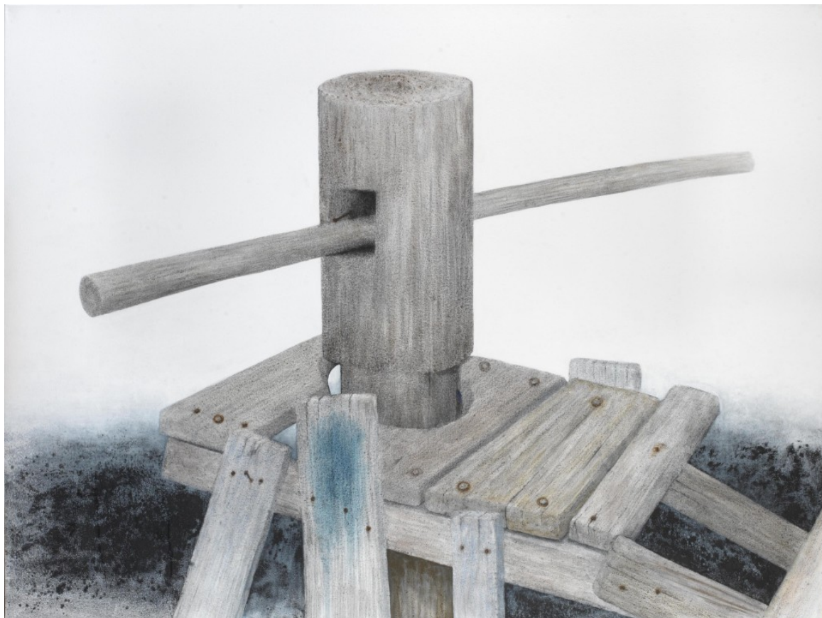
Σ.Σόρογκας,Τροχαλία για καΐκια στην Ιερισσό,150×200εκ..

αρχαίο μύθο που τον περιβάλλει, όσο και με την ύπαρξη ενός μυστηριώδους στις νοηματοδοτήσεις του απαστράπτοντος φωτός, που τον προσδιορίζει. Τελικά, όπως άλλωστε έχει αναφερθεί, αυτή η θεοφόρος συνάφεια φωτός, μύθου, ιστορίας και τόπου συγκροτεί τα θεμελιώδη χαρακτηριστικά όλων των εκφάνσεων της ελληνικής τέχνης από τον Όμηρο και την Αρχαία Τραγωδία μέχρι σήμερα.