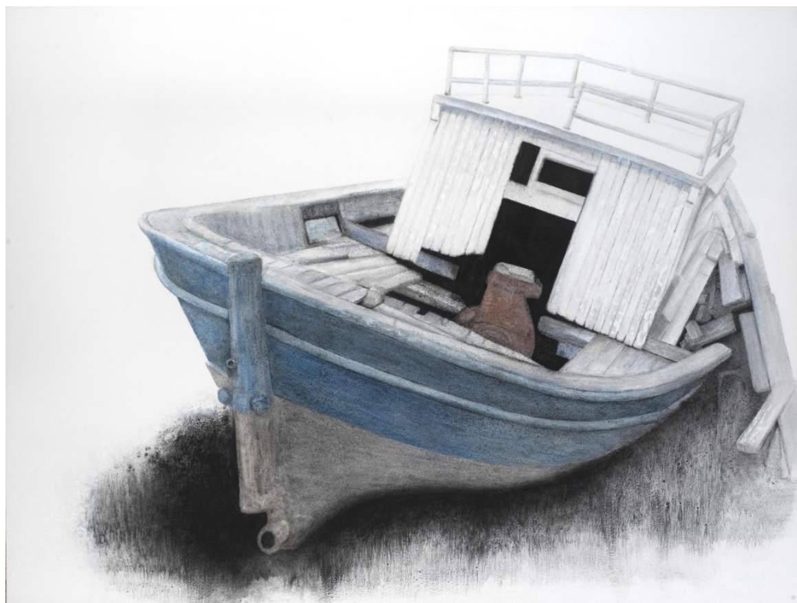
Σ.Σόρογκας, Παλιό καΐκι στο Λαύριο, 150x200εκ

Η χειρονομία της κάθε του πινελιάς είναι λεπτή και αντισυμβατική, με αναγνωρίσιμο το προσωπικό του ύφος. Εκείνο που τον ενδιαφέρει είναι η λειτουργία της ζωγραφικής ως αδιαίρετου όλου, οδηγώντας μας στην αισθητική του θεώρηση, στη δική του απόλυτη ομορφιά, στην προσωπική του μορφική σύλληψη. Τα έργα του έχουν ρυθμό, αρμονία, συνθετική ισορροπία, δύναμη και εκφραστική ελευθερία. Όπως τα Καΐκια του, της τελευταίας του δουλειάς, τα οποία ακινητοποιημένα πάνω στη γη και άλλοτε σε μια ακαθόριστη λευκή επιφάνεια, δίνουν την εντύπωση πλεύσης, αποκαλύπτοντας την επιθυμία του δικού του νόστου, του δικού του ατέλειωτου ταξιδιού. Οι βάρκες και τα καΐκια του κουβαλούν το όνειρο και την ψυχή των λαών της Μεσογείου...»