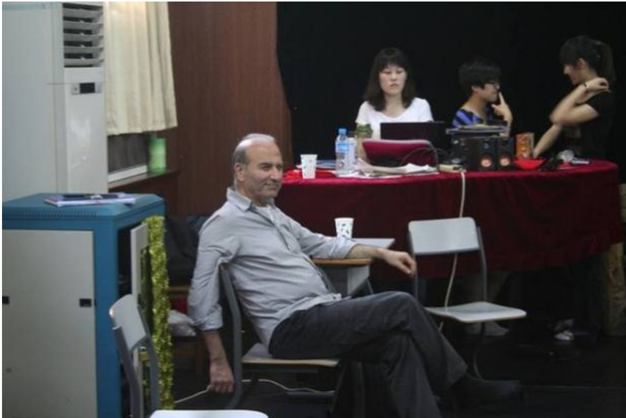
Θεόδωρος Τερζόπουλος

Ο διεθνής Έλληνας σκηνοθέτης θα παρουσιάσει από 1η Ιουνίου την αισχύλεια τραγωδία στην κινεζική πρωτεύουσα.