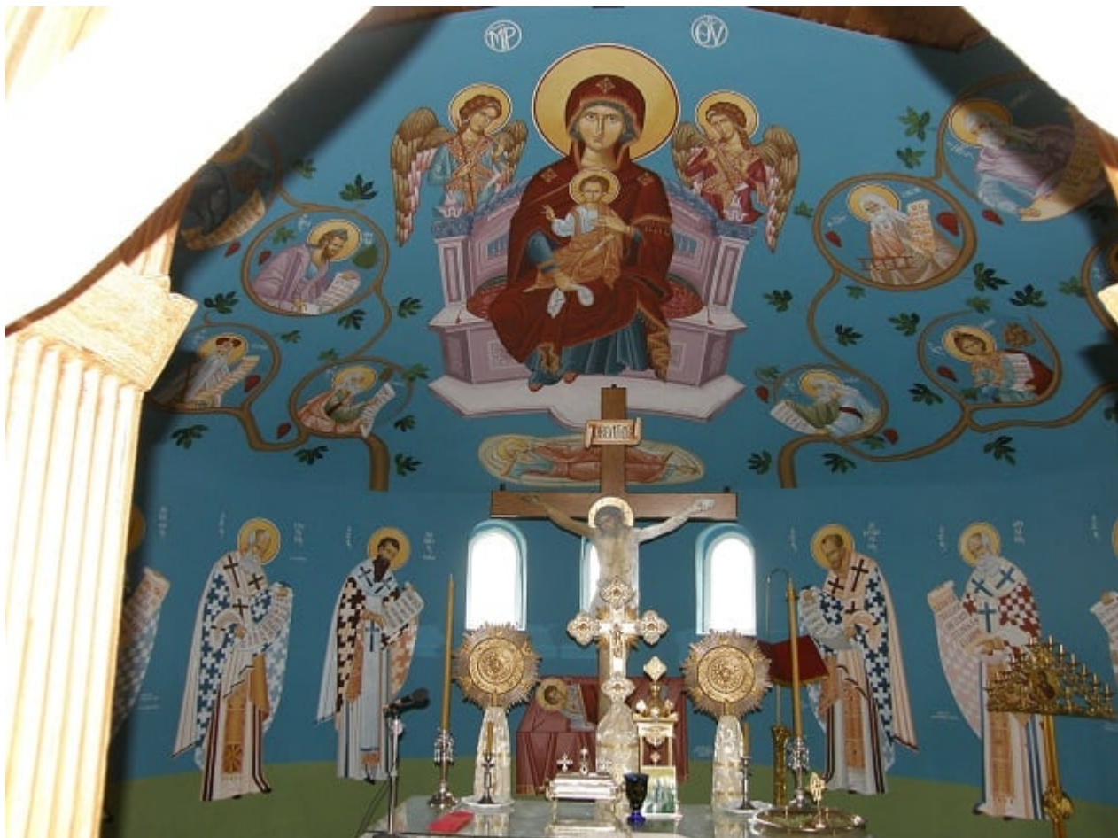
«Η Πλατυτέρα των Ουρανών», ακρυλικά και πλαστικά χρώματα με σκόνη αγιογραφίας σε μουσαμά, 2004 - έργο πρεσβυτέρας Μαρίας Τοτού (Εικονογραφικός τύπος σε συνδυασμό με την παράσταση «Άνωθεν οί Προφήται» - απαντάται κατά την Μεταβυζαντινή εποχή και κυρίως από τον 17ο αι. και μετά)