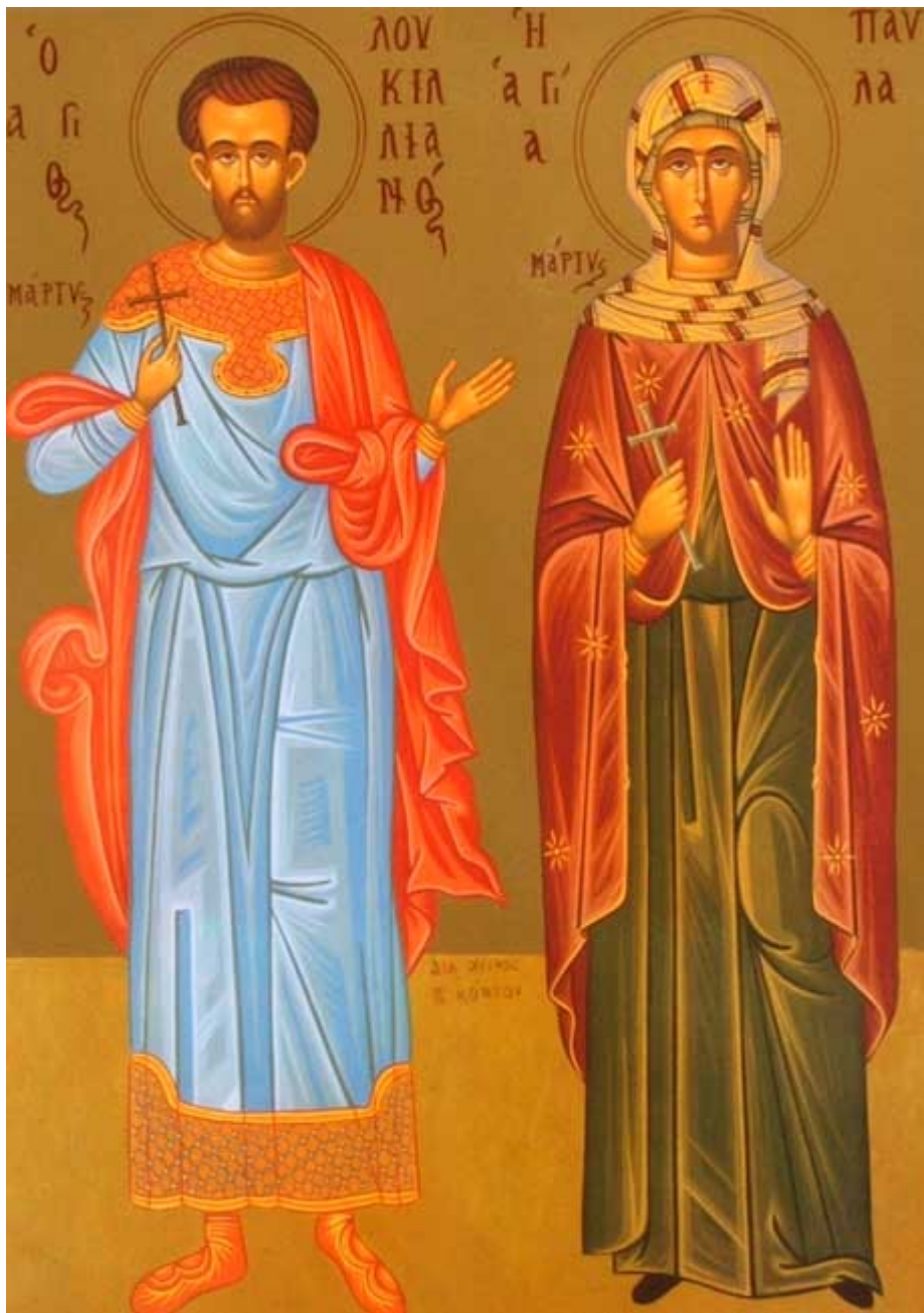
Οι άγιοι μάρτυρες Λουκιλιανός και Παύλη