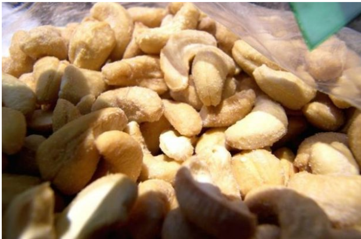
4. Ξηροί καρποί- κάσιους