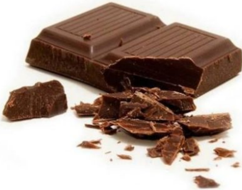
6. Μαύρη σοκολάτα