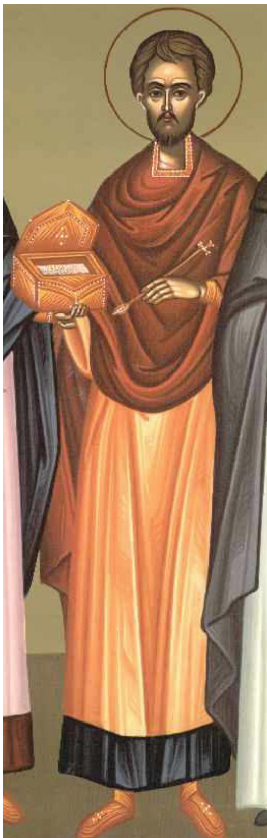
Άγιος Ιωάννης ο Ανάργυρος