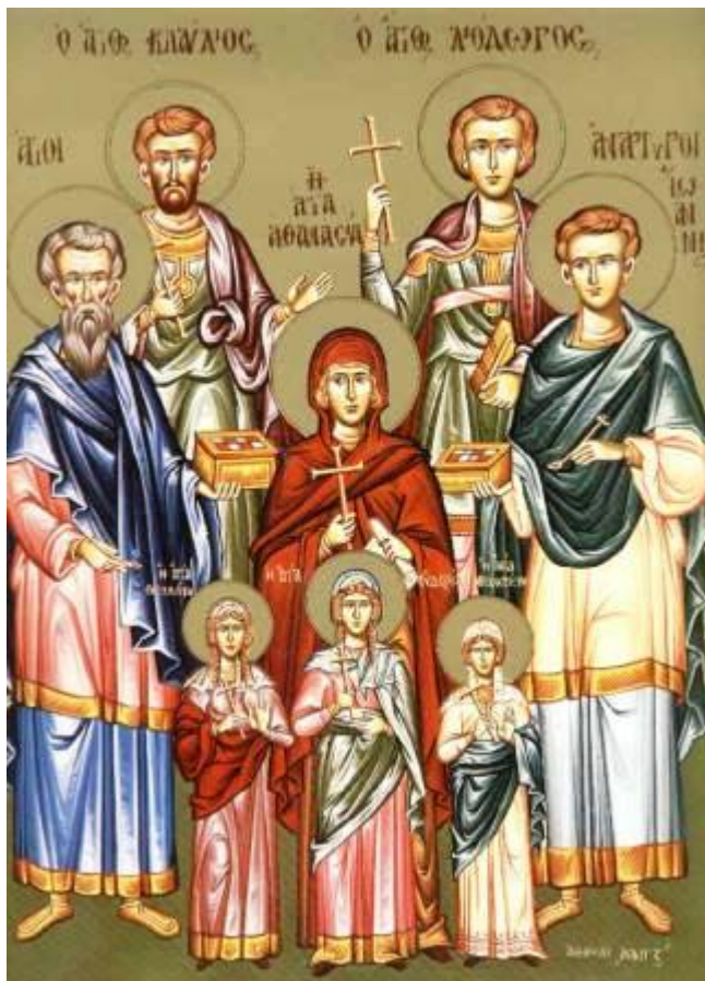
Εύρεση των Τιμίων Λειψάνων των Αγίων Αναργύρων Κύρου και Ιωάννου