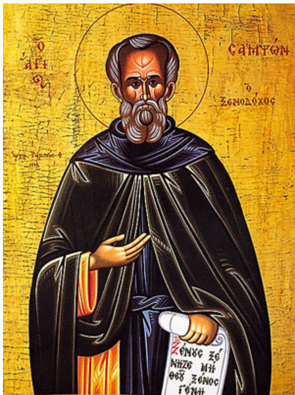
Άγιος Σαμψών ο Ξενοδόχος