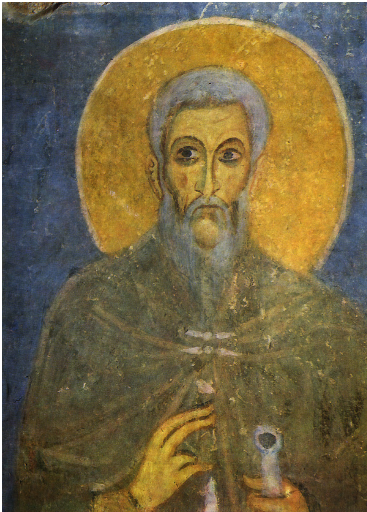
Άγιος Κύρος ο Ανάργυρος