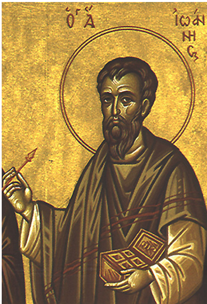
Άγιος Ιωάννης ο Ανάργυρος