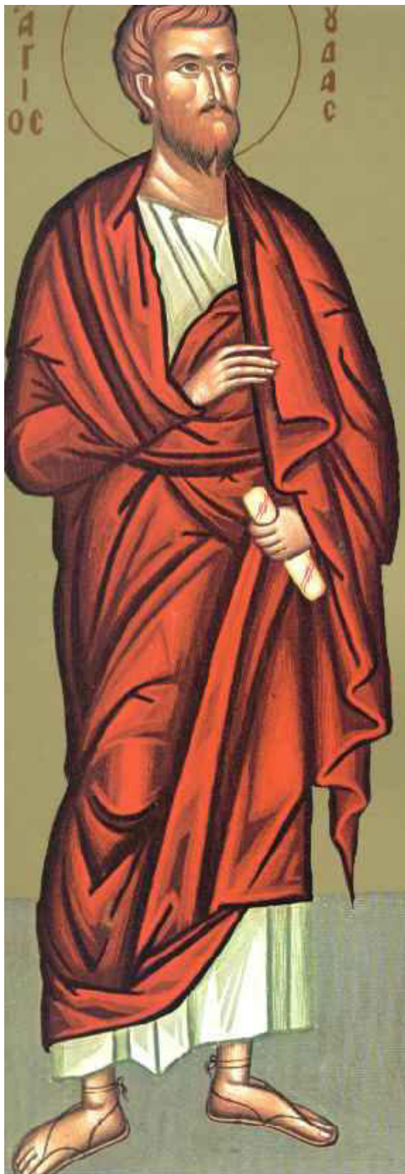
Άγιος Ιούδας ο Απόστολος