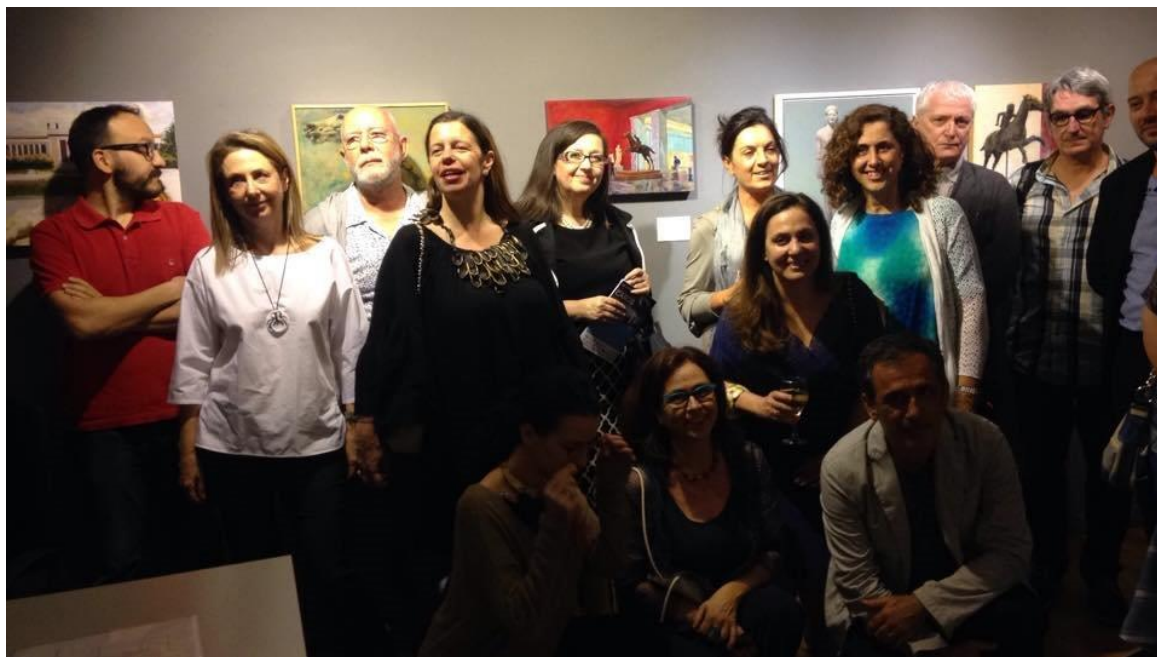
Από την ημέρα των εγκαινίων

Οι συμμετέχοντες καλλιτέχνες εμπνέονται από τα εκθέματα των συλλογών του Μουσείου, το κτίριο και την ιστορία του. Ο καθένας μέσα από την προσωπική του ματιά αποτυπώνει διαφορετικές θεάσεις του χώρου και των δράσεων του Μουσείου.